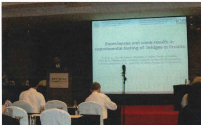
Slika 1. Prezentacija rada.

U Pekingu je od 17. do 18. rujna 2007. godine održana Peta međunarodna konferencija o sadašnjim i budućim trendovima u projektiranju, gradnji i održavanju mostova. Konferencija je održana u organizaciji ICE (Institution of Civil Engineers – Organizacija inženjera graditeljstva). Želja organizatora je bila okupiti eminentne stručnjake cijeloga Svijeta koji bi iskazali i prezentirali svoja iskustva i spoznaje u cilju napretka na području mostogradnje.