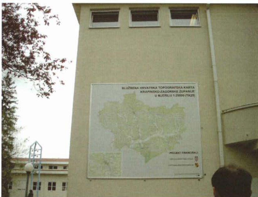
Slika 2. Kartozid Krapinsko-zagorske županije.