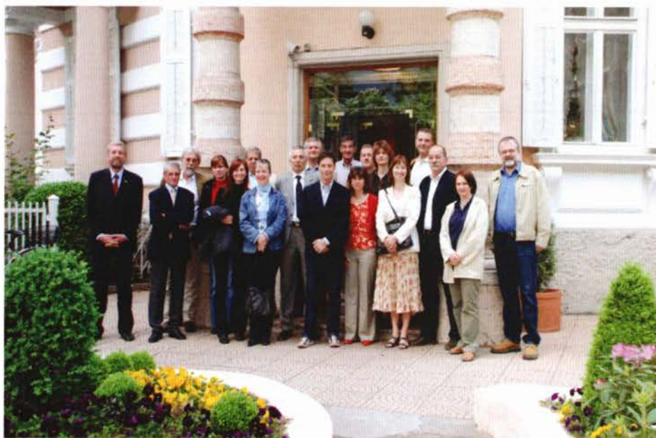
Slika 1. Sudionici Fachtagunga.

Na kraju ovogodišnje skupštine, za domaćina iduće skupštine javili su se predstavnici iz Slovačke te je predložena tema sljedeće 26. skupštine: " Korištenje servisa za satelitsko pozicioniranje u katastru nekretnina ".