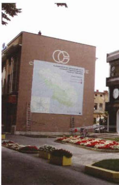
Slika 3. Kartozid Virovitičko-podravske županije.