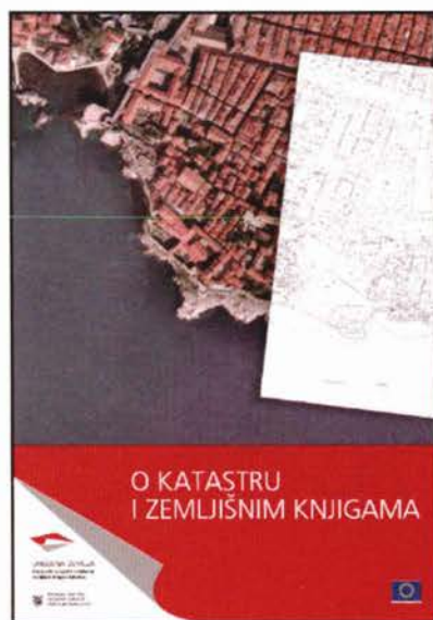
Slika 1. Brošura o katastru i zemljišnim knjigama.

U sklopu aktivnosti zajedničke Kampanje informiranja javnosti Državne geodetske uprave i Ministarstva pravosuđa preko Projekta sređivanja zemljišnih knjiga i katastra, u Zagrebu je krajem svibnja predstavljena nova zajednička "Brošura o katastru i zemljišnim knjigama". Brošura je namijenjena općoj javnosti, a dostupna je u svakoj gruntovnici i katastarskom uredu u Hrvatskoj te je ujedno distribuirana i kroz dnevni tisak još u lipnju ove godine svim građanima Hrvatske. Brošura sadrži mnoge korisne informacije iz područja katastra i zemljišnih knjiga te jednostavnim rječnikom objašnjava pojmove i postupke sustava registracije nekretnina i prava nad njima. S ciljem pružanja relevantnih informacija i ubrzanja rješavanja zemljišno-knjižnih predmeta u rad je službeno pušten i Info-telefon Ministarstva pravosuđa na kojem građani mogu dobiti servisne informacije o zemljišnim knjigama. Info-telefon ne pruža pravne savjete, ali pozivom na telefonski broj 062 72 72 73, građani mogu saznati status njihovog predmeta, visinu propisanih tarifa, dobiti pomoć u pretrazi zemljišne knjige na Internetu, dobiti adrese i kontakt informacije pojedine gruntovnice te saznati koje dokumente trebaju dostaviti sudu obzirom na njihov predmet.