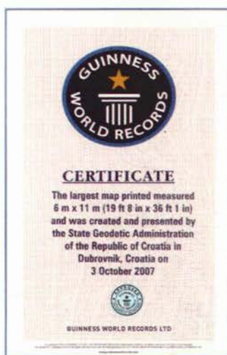
Slika 4. Certifikat Guinnessove knjige rekorda.