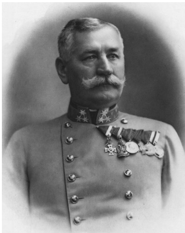
Slika 4. Michael Freiherr Tišljár von Lentulis počasni general pješaštva