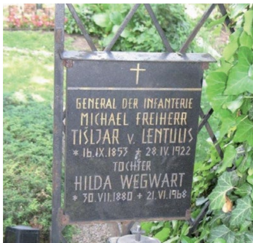
Slika 5. Grob generala Michaela Freiherr Tišljár von Lentulisa u Beču