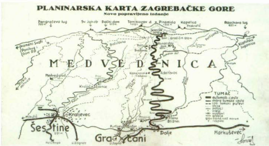
Slika 1. Planinarska karta Zagrebačke gore.

Među zanimljivim prikazima je Planinarska karta Zagrebačke gore (slika 1) i to Novo popravljeno izdanje (kaširani papir 10 x 12 cm) koju je izradio Vladimir Horvat uz nov-