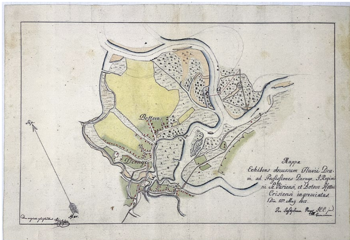
Slika 2. Karta (plan) naselja Drnje (Dernye) iz 1812. godine – iz zaselka Posomuk stanovnici su se zbog poplava preselili 1822. na područje sela Gole u Prekodravlju

Gotalovo mlađa je naseobina od Gole. Ono je nastalo 6 (šest) godina kasnije od Gole. Naseobina započela je god. 1828. Gotalovčani [4] će dakle svoju stogodišnjicu slaviti tek za 6 godina (1928!).