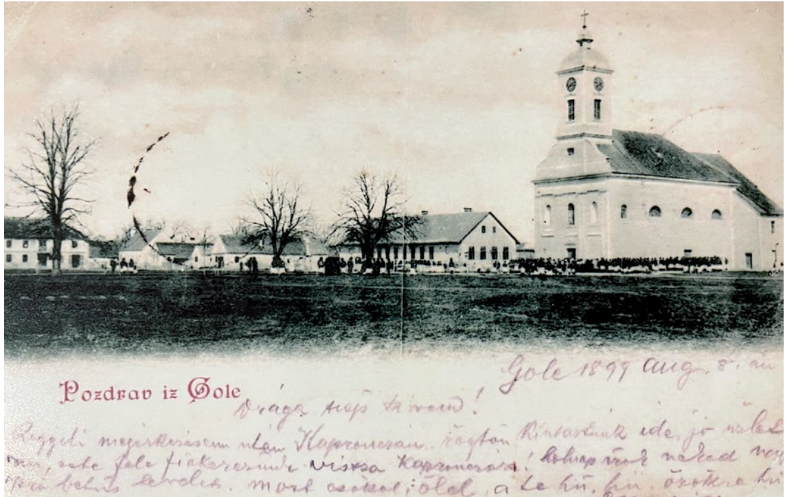
Slika 4. Razglednica središta Gole iz 1899. godine

Naravno ta crkva nije u početku tako izgledala – kako danas. Tijekom vremena od 80 god. koješta je na toj crkvi ispravljeno i nadopunjeno tako na pr. crkveni prozori su povećani i produljeni, a u najnovije vreme novi žrtvenici namješteni i crkva slikana itd.