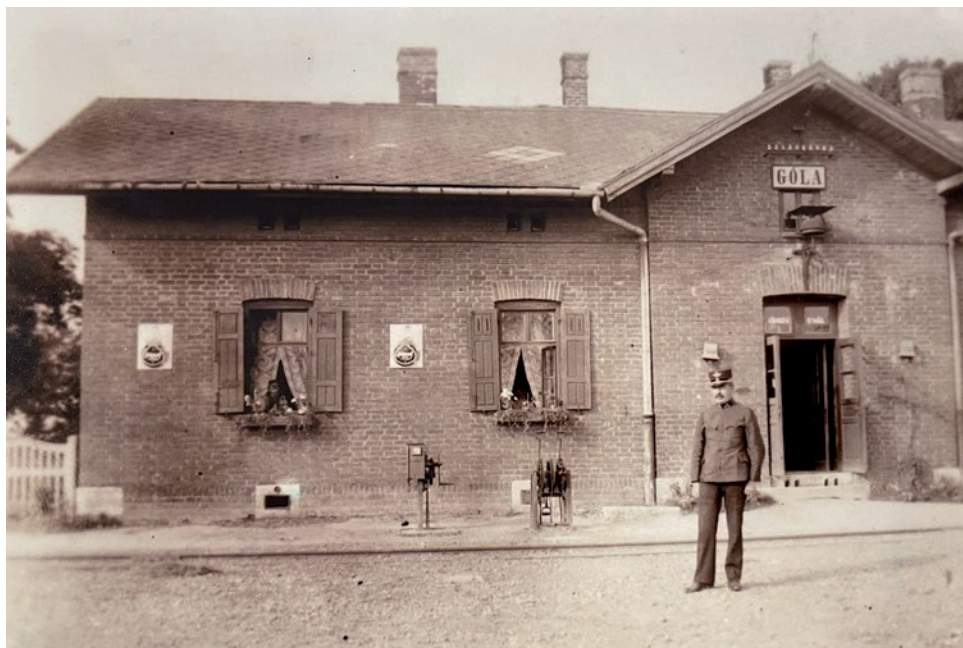
Slika 5. Željeznička postaja Gola (danas u Mađarskoj)

God. 1858. srušena je ta stara škola, a na istom mjestu izgrađena je nova školska zgrada. Ta je zgrada imala dva predjela. U jednom predjelu sa tri razreda učilo se njemački, a u drugom predjelu sa dva razreda učilo se hrvatski. Godine 1871. prestade njemačka škola, pak se je u škola uvela osnova, kakva je već prije opstojala u provincijalu.