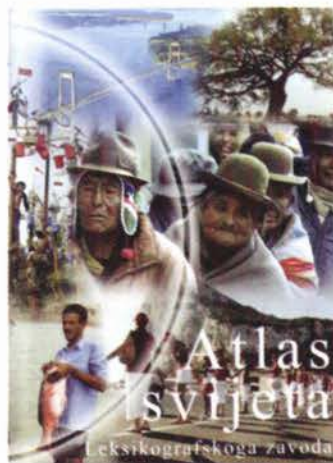
Slika 1. Atlas svijeta Leksikografskog zavoda.

Sadržaj Atlasa podijeljen je u četiri cjeline. U prvom je dijelu politička karta svijeta, a tekstualni dio dopunjen je tematskim kartama svijeta koje prikazuju procese kao što su: dekolonizacija u svijetu, podjela svjetskog epikontinentalnoga pojasa, proizvodnja, potrošnja i zalihе svjetske nafte. Nakon toga Atlas donosi podatke o državama članicama UN-a, UN-ovim mirovnim operacijama itd.