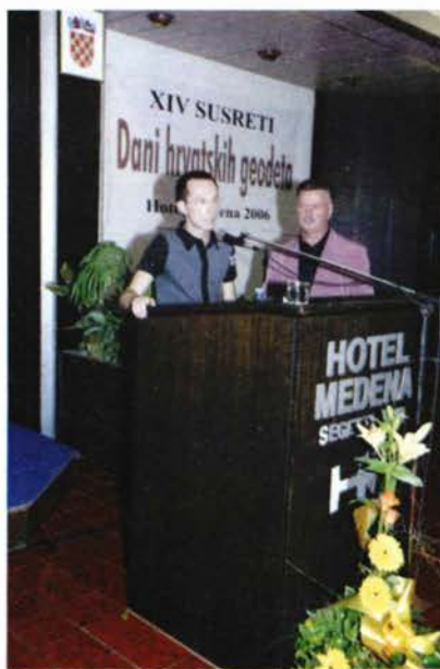
Slika 13. Sin gospodina Habeka zahvaljuje na Priznanju.