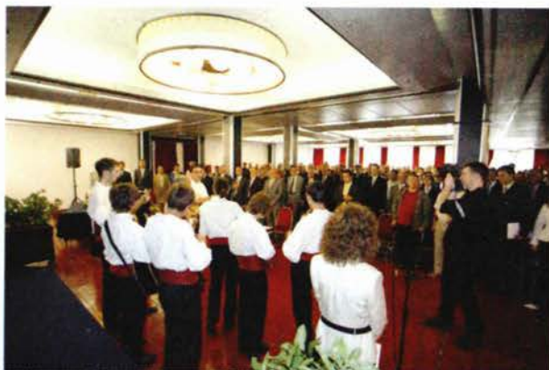
Slika 1. Sabornici za vrijeme sviranja državne himne.