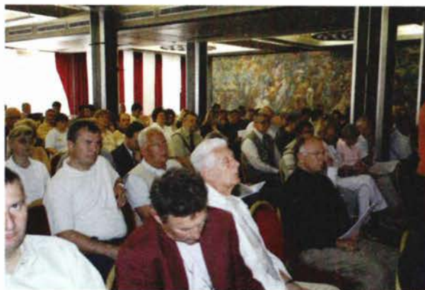
Slika 4. Sudionici na 9. Saboru Hrvatskoga geodetskoga društva.

2.094,77 eura obveza prema FIG-i u smislu plaćanja članarine podmirili smo odmah nakon ispostavljenog računa. To se odnosi i na članarinu sekcije za fotogrametriju