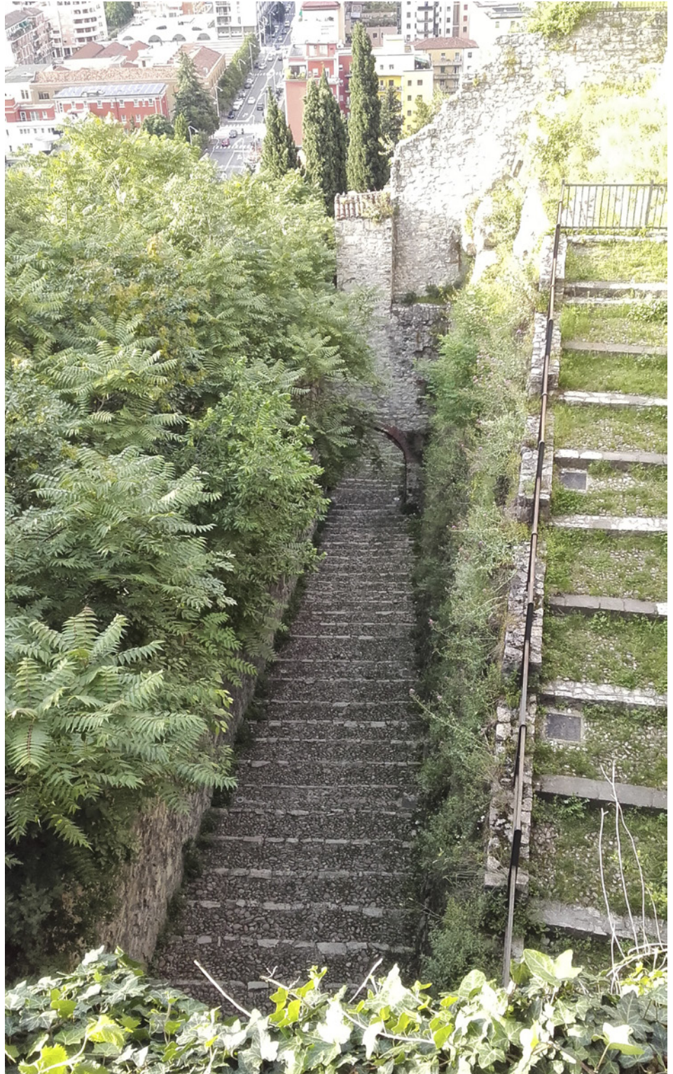
3. Pogled na stradu del soccorso u kaštelu u Bresciji

Brescije Veneciji već sagrađena, najkasnije 1425. godine. Prema Guarneriju strada del soccorso u kaštelu u Bresciji potječe iz doba vladavine obitelji Visconti, ali za to ipak ne nudi dodatne dokaze. 31 Općenito, vidljiva je tendencija da se manje-više sve fortifikacijske strukture na kaštelu u Bresciji, koje nisu mletačke, bez ikakve ogra-