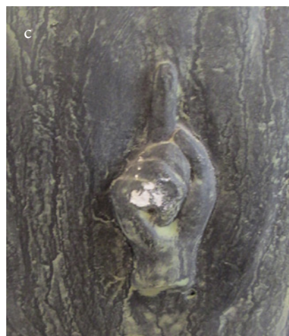
3c. Autorov znak na začelju biste

Artist's signature and date on the back of the bust