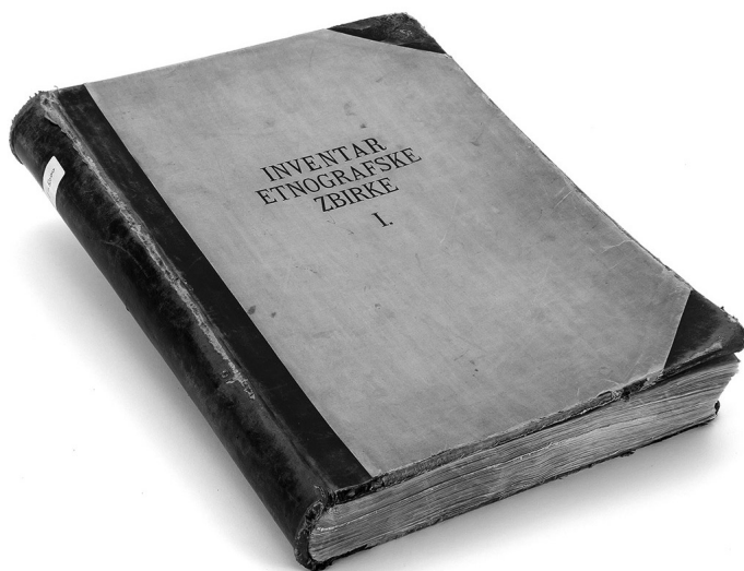
Slika 1. Inventarna knjiga I, Etnografski muzej, Zagreb, foto: Nina Koydl