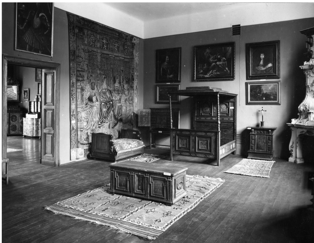
Slika 2. U dvorani renesanse (F 5213) izložen je bosanski ćilim MUO 6206, smješten na pod ispod škrinje, a pored kreveta nalazi se cazinski ćupavac MUO 5654., Muzej za umjetnost i obrt

radi o jednom od tipičnih primjera orijentalnih sagova, a nađen je ispod poda stare barokne zagrebačke katedrale i Muzeju ga je darovao Herman Bollé, najvjerojatnije je bio i dio postava iz 1937. godine. Na fotografijama F 5218 i F 726 ne vidi se južni zid galerije te ne znamo koji su predmeti ondje bili postavljeni, dok se na istočnom zidu među prikazanim izloženim predmetima ne može detektirati niti jedan sag ili ćilim. Izloženi predmeti koji su obješeni na zid (MUO 3557, MUO 3560, MUO 3558, MUO 4201 i MUO 6761/1) bili su, radi rastećenja površine, prošivanjem pričvršćeni na podlogu od jute koja je potom metalnim kukama obješena na zid. Na isti način bila su opremljena i tri cazinska ćilima (MUO 6105, MUO 29422, MUO 5143) i sag Ženske tkalačke škole (MUO 3566) koji su prebačeni preko ograde galerije drugog kata. Osim ovih izloženih u postavu, na još šesnaest predmeta do danas se sačuvala prišivena podloga od jute s metalnim kukama. Moguće je da su i ti predmeti u jednom trenutku bili izloženi na galeriji drugog kata. Na sagu MUO 5414 još je pričvršćena legenda s atribucijom i datacijom saga: „sag perzijski Ferahan, oko 1800. god.“. Temeljem usporedne analize fotografija galerije drugog kata zaključeno je da su se predmeti u postavu mijenjali nakon jedne ili dvije godine, tj. da je Vladimir Tkalčić već tada primijenio muzeološku koncepciju kakvu danas znamo pod imenom