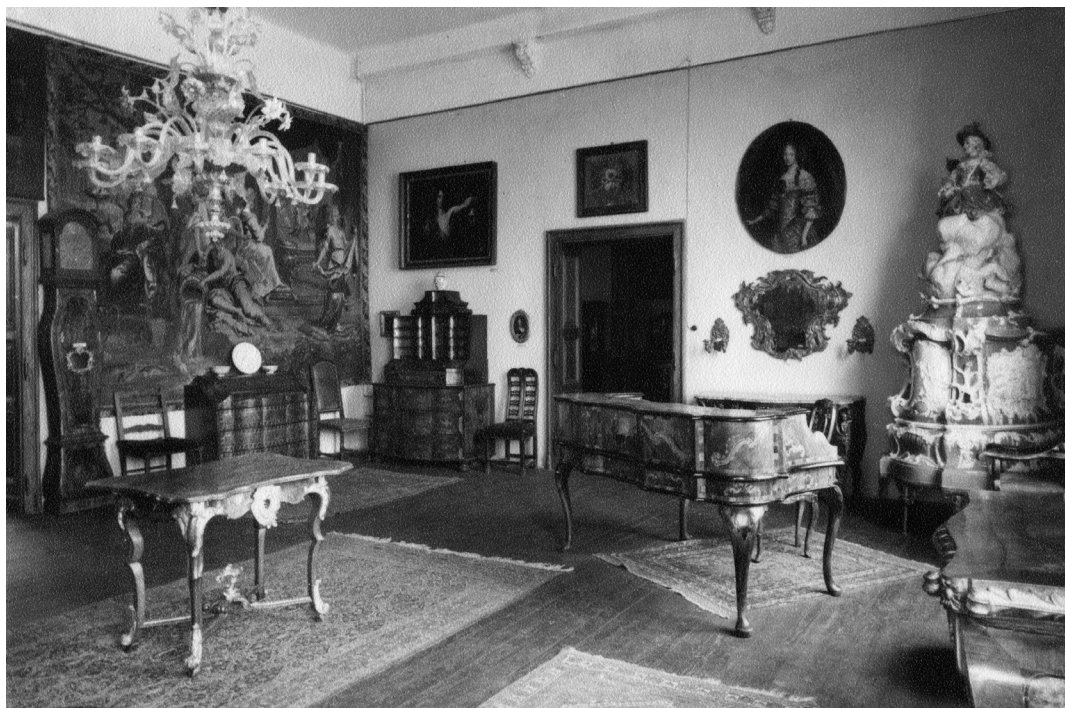
Slika 3. Dvorana s pokućstvom 18. i 19. stoljeća (F 5215) ukrašena je s dva cazinska ćilima: ispod klavira u središtu sobe nalazi se ćilim MUO 6205, a ispod stolića s dva stolca smješten je ćilim MUO 6147, Muzej za umjetnost i obrt