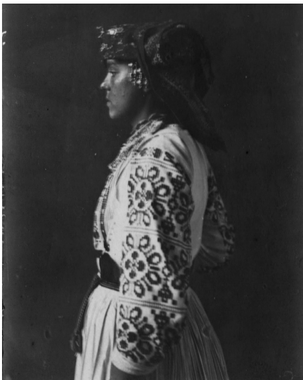
Slika 2. Djevojka u nošnji iz Zadvorskog.