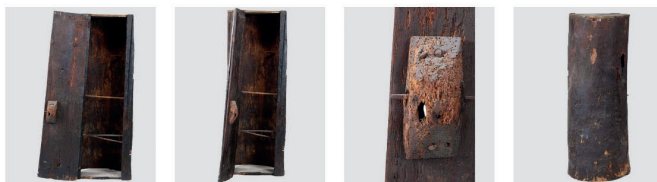
Etnoografski muzej, Zbirka pokućstva, EMZ 8877

Najstarija škrinja u zbirci pokućstva potječe vjerojatno iz 18. stoljeća, jer ukazuje na stariju tradiciju izrade te vrste pokućstva. Riječ je o ormaru (škrinji) koji je u muzejskoj dokumentaciji upisan pod nazivom ormar, starinski, od izdubenog lipovog debila koje je prerezano na pola. Umetnuta su mu vrata od hrastovih dasaka. U unutrašnjosti se nalaze tri police koje su služile kao pregrade. Police leže na šikama zadržavajući u rupe probušene u stijenu ormara. S obzirom da je u muzejski fondus došao početkom 19. stoljeća, odnosno, kupljen je 1931. godine od Ignacija Keretića koji je bio župnik u Žazini u Posavini, prije dolaska u muzej imao je izuzetno dugu povijest.