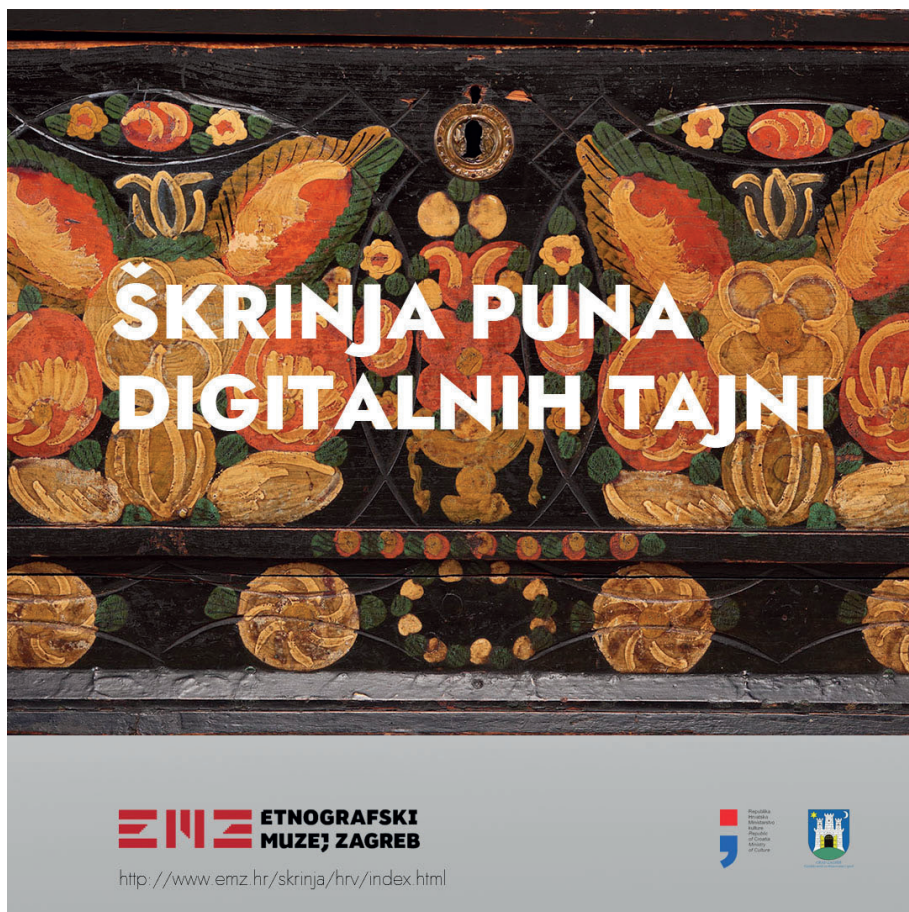
Slika 1. Naslovnica virtualne izložbe dostupne na www.emz.hr/skrinja/hrv/index.html

namjene i korištenja preko izrade i ukrašavanja do simbolike predmeta. Kako bismo približili posjetiteljima bogati muzejski fondus omogućeno im je virtualno istraživanje i detaljniji uvid u zbirku škrinja kroz nekoliko tema ( O zbirci, Istraži najzanimljivije primjerke iz muzejske zbirke, Otkrij priče – škrinja prepuna značenja: svadbena škrinja i pomorska škrinja i Škrinjine tajne ). U prvoj temi o zbirci škrinja istaknuti su najzanimljiviji predmeti s detaljnijim opisima i fotografijama. Ukoliko posjetitelja zanima detaljniji pregled predmeta, to je omogućeno uvećanjem pojedinih detalja, kao i detaljnijim opisom iz muzejske baze podataka. Druga tema poziva posjetitelje na istraživanje najzanimljivijih primjeraka škrinja iz muzejske zbirke i na upoznavanje s njihovom raznovršnošću i brojnim primjercima. Vanjski izgled škrinje često je odavao važnost unutrašnjeg sadržaja pa se one pojavljuju u različitim oblicima i materijalima te s različitim ukrasima. Osobito su ukrasi bili podložni međusobnim utjecajima i prožimanjima. Posebna je pozornost bila usmjerena na važnost ukrasa na pojedinim škrinjama čiji su se detalji mogli pomnije uvećati i razmotriti.