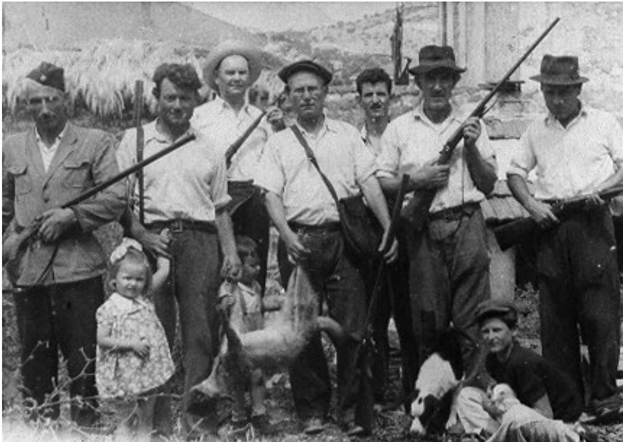
Luški kačaduri s ulovljenim čagljem u prvomajskoj kači. Arhivski sabirni centar Korčula-Lastovo, Zbirka preslika

Radojica je voli radit poslove kolo pokojnika i često jih je vozi tamo kud je to služilo. Vozi je un iz Luke do Beograda i pokojnoga poznatoga filmskog glumca Severina Bijelića, i pokojnoga, također glumca, Cigu Jeremića koji su u ono vrijeme iznenada, jedan za drugin umrili u Gradini.