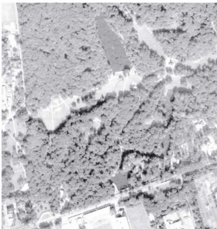
Kopija aerofotogrametrijskog snimka Maksimirskog perivoja danas

Danas cijeli posao oko golfskog igrališta koordinira Ministarstvo turizma, koje je osnovalo konzorcij za studiju generalnoga, glavnoga, detaljnog i izvedbenog projekta. U idućih deset godina Hrvatska bi, najavljuje se, trebala imati između 50 i 60 golfskih terena. Računa se da je cijena samo pripremnih poslova po igralištu oko 50 000 eura, a gradnja oko 10 milijuna eura.