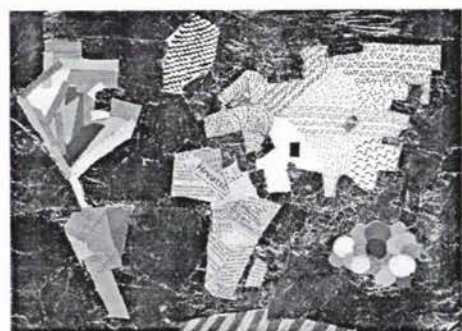
Apstraktna karta, Ana Bilić (14 god.)