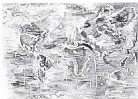
Ekološka karta svijeta, Amela Kičić (13 god.)

Čestitamo učenicima i njihovim nastavniciima i želimo im puno uspjeha na izložbi u Kini. Sekcija za kartografiju Hrvatskoga geodetskog društva organizirat će na jesen svečanu sjednicu na koju će biti pozvani predstavnici svih institucija koje su sudjelovale sa svojim radovima i uručiti im prigodne poklone i priznanja.