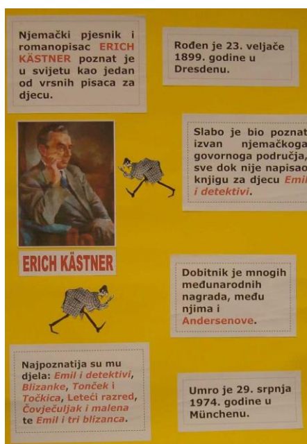
Slika 2. Plakat o Erichu Kästneru

Učenici dobivaju za rad kod kuće poticajne listiće sastavljene u tri razine, ovisno o sposobnostima učenika, koje će popuniti za vrijeme čitanja lektirnog djela. Isto tako dobivaju zadatak osmisлити naslovnicu ovog lektirnog djela.