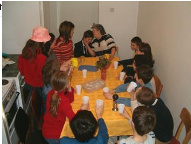
Slika 21. Veliko slavlje