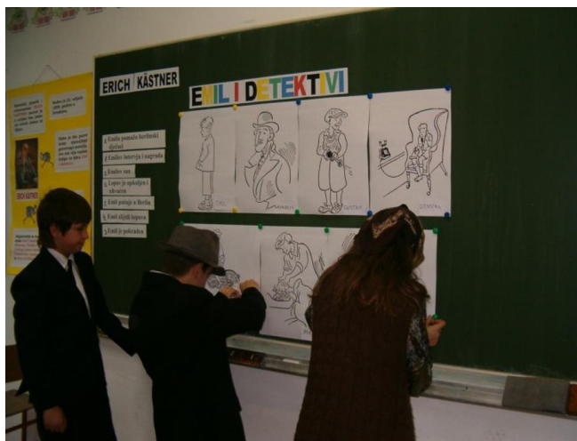
Slika 7. Tko je tko

Slijedi karakterizacija likova te određivanje vrste književnog djela, mjesta i vremena radnje. Učenici iznose svoje dojmove i razmišljanja o likovima.