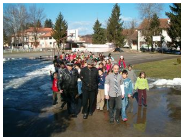
Slika 18. Privođenje lopova