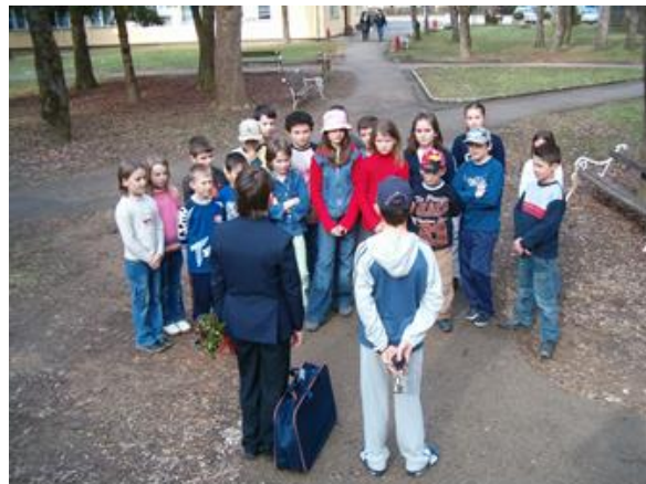
Slika 14. Okupljanje detektiva