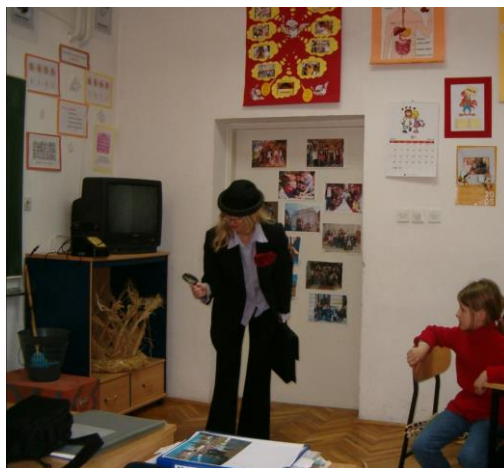
Slika 1. Učiteljica kao detektiv

Kao uvod se održava motivacijski sat. Na sat učiteljica/učitelj dolazi odjeven u odijelo i ima povećalo u ruci. Povećalom proučava predmete u učionici. Zapita učenike koga glumi. Učenici odgovaraju da je riječ o detektivu. Tada učenici dobivaju zadatak napisati tko je to detektiv. Učenici se prisjećaju poznatih detektiva iz filmova, stripova... Učiteljica/učitelj čita ulomak iz romana „Emil i detektivi“ i vrši se analiza pročitanog. Nakon toga učenici istražuju tko je bio Erich Kästner i izrađuju plakat.