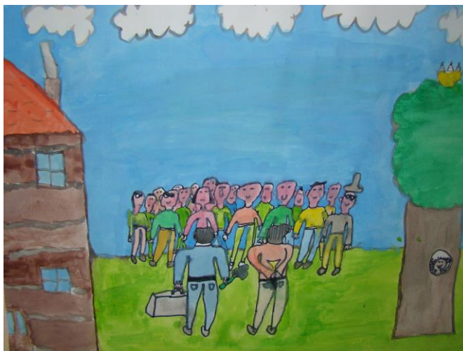
Slika 8. Likovni rad – Okupljanje detektiva

Ovisno o interesima i ranijem dogovoru, učenici se likovno izražavaju ili pak izvode igrokaz.