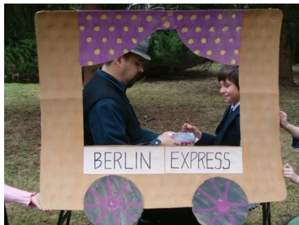
Slika 11. Putovanje vlakom