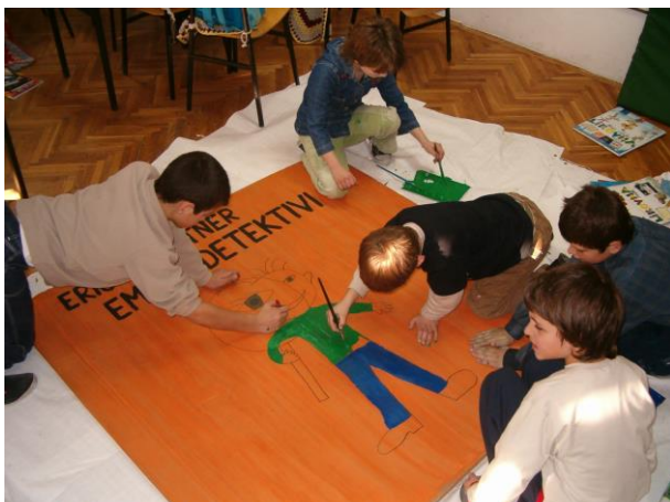
Slika 3. Izrada naslovnice

Učenici su nakon ranijeg dogovora raspoređeni u skupine i izrađuju svoju naslovnicu ovog lektirnog djela. Za ovu vrstu likovnog izražavanja pripremili su potreban pribor za rad (veliki karton, boje, škare...).