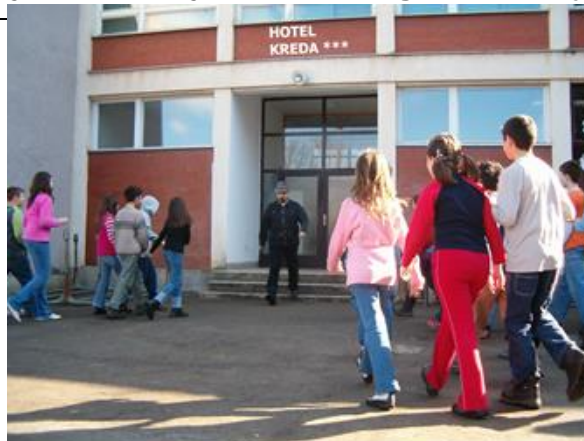
Slika 16. Grundeist dobiva počasnu gardu