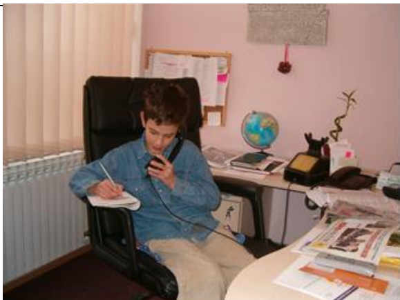
Slika 15. Dienstag u akciji