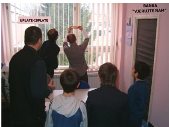
Slika 17. Dokazana krivnja