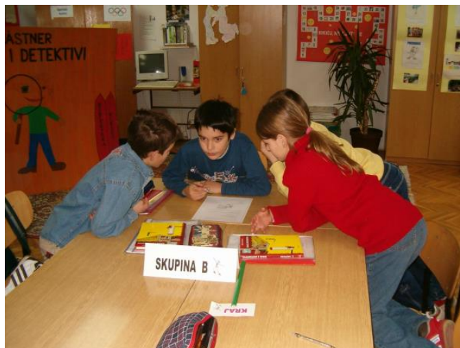
Slika 6. Rješavanje nastavnog listića

Nastavni listić sadrži različite tipove zadataka, a zadatci se razlikuju od skupine do skupine.