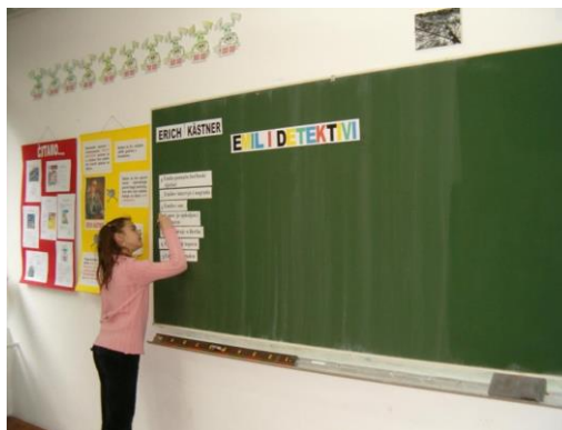
Slika 5. Određivanje kronološkog slijeda događaja

Učenici radom u skupinama određuju kronološki slijed događaja, a zatim dolaze pred ploču provjeriti sastavljeno.