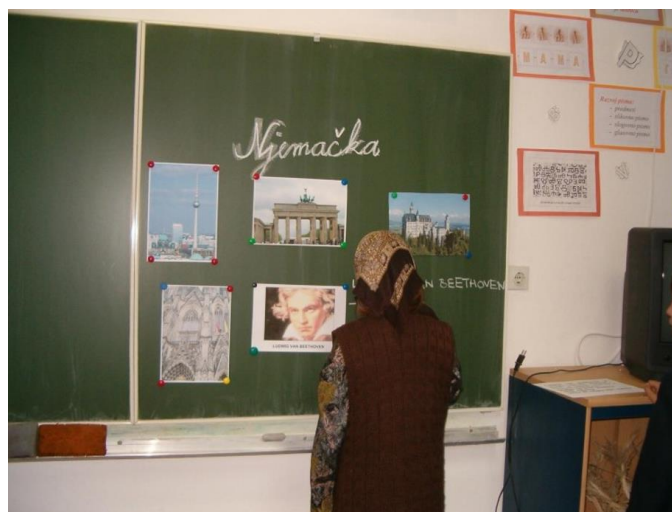
Slika 9. Sznali smo o Njemačkoj

Jedan od zadataka u poticajnom listiću, treća razina, bio je saznati i nešto o Njemačkoj kao mjestu rođenja Ericha Kästnera te mjestu radnje u romanu. Učenici prikazuju istraženo.