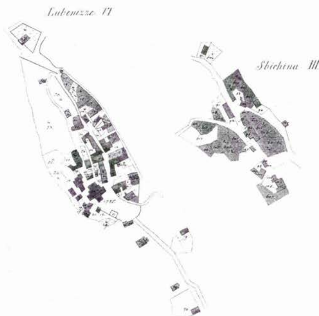
kataloški broj 18, (katastarski plan Lubenica)