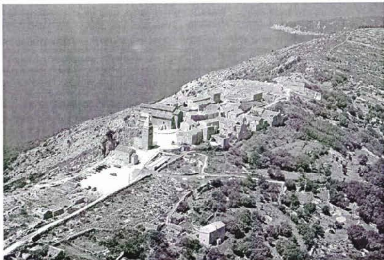
Lubenice iz zraka.

Organizator izložbe, Centar za održivi razvoj – Ekopark Pernat provodi niz projekata na području Lubenica odnosno poluotoka Pernat na otoku Cresu. Njegov je cilj da integralnim pristupom promiče očuvanje autohtonog pučkoga graditeljstva, valorizaciju prirodnog i kulturno-povijesnog naslijeđa, revitalizaciju lokalnoga gospodarstva, primjenu obnovljivih izvora energije, zaštitu okoliša, uređenje krajolika interpretacijom okoline te razvija i provodi projekte vezane za održivi otočni turizam.