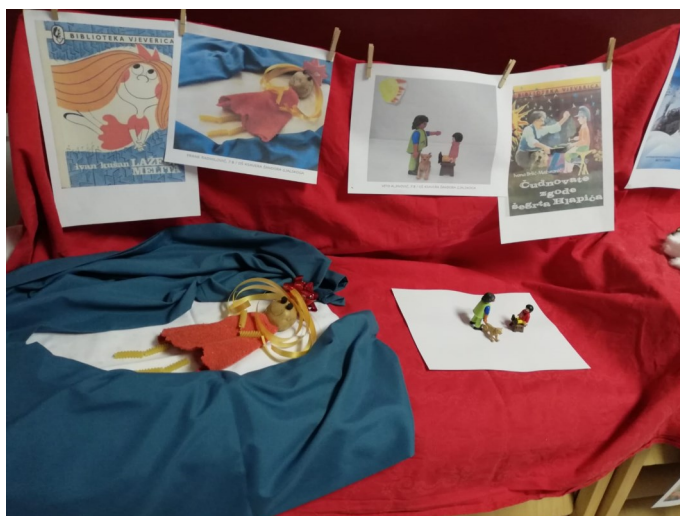
Slika 2. Dio izložbe „Ajmo HRVATI se s naslovnicom“

Nakon virtualne izložbe u prostorijama Osnovne škole Lovre pl. Matačića postavljena je i fizička izložba radova pod nazivom Ajmo HRVATI se s naslovnicom na kojoj su, osim ispisanih fotografskih radova bili uključeni i fizički eksponati učenika. U dogovoru s učiteljicama Hrvatskoga jezika, učenici su uz vodstvo knjižničarki posjetili izložbu, na kojoj ih se posebno dojmilo nekoliko originalnih kreacija koje su učenici školi ustupili za izložbu.