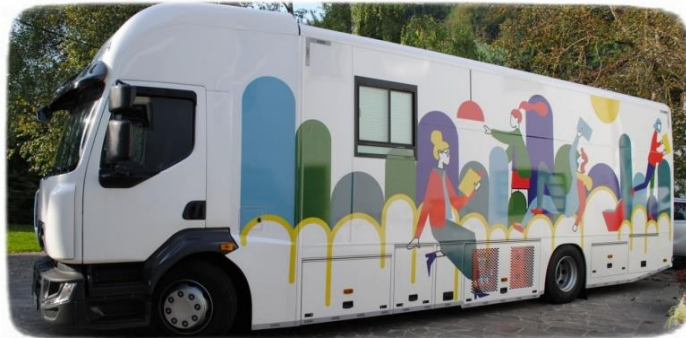
Slika 1: Bibliobus

Raka je malo mjesto u općini Krško, tako da nam je 5. listopada 2020. putujuća knjižnica donijela mnogo veselja, jer nudi i gradivo koje nemamo u svojoj školskoj knjižnici. Jednom mjesečno Bibliobus se zaustavi i ispred Osnovne škole Raka. Tada učenici dobivaju priliku posuditi gradivo koje im je potrebno i koje žele pročitati.