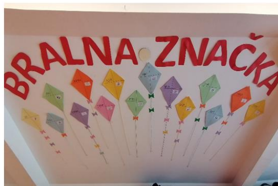
Slike 2 i 3: Plakat na temu osvajanja čitateljske značke