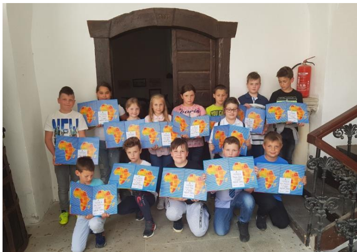
Slika 6: Dodjela priznanja povodom završetka provedbe Čitateljske značke

Na kraju 3., 6. i 9. razreda učenici dobivaju i knjige, kao poticaj za čitanje.