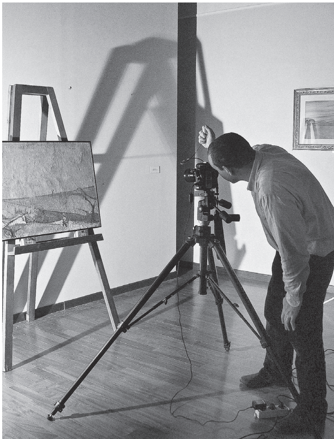
↑ Snimanje infracrvenim zrakama tijekom nedestruktivnih istraživanja slika Osvalda Licinija u Galeriji suvremene umjetnosti u Ascoli Picenu