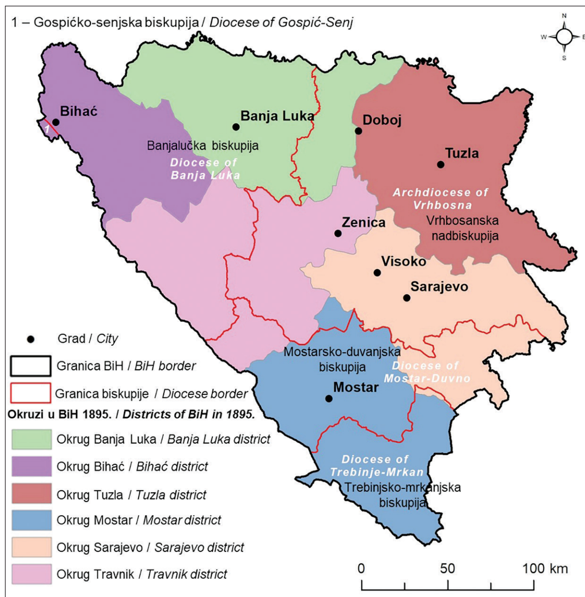
SLIKA 1. Austro-ugarsko administrativno uređenje i granice biskupija u Bosni i Hercegovini 1895.

FIGURE 1 Austro-Hungarian administrative organization and diocesan borders in Bosnia and Herzegovina in 1895