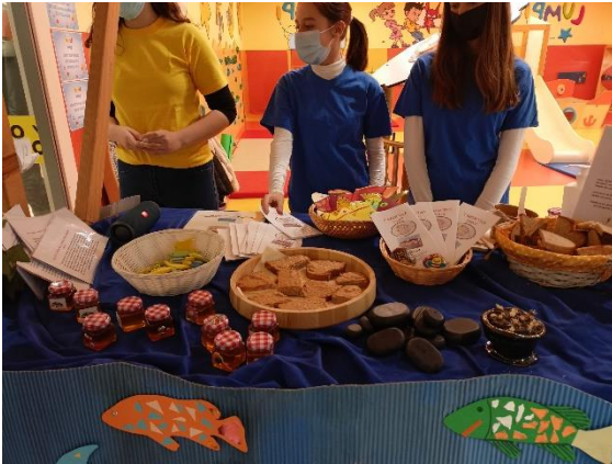
Slika 2: Suvenirni na tržnici

Svi učenici predložili su svoje ideje za suvenire i štand. Bili su samostalni i kreativni u radu.