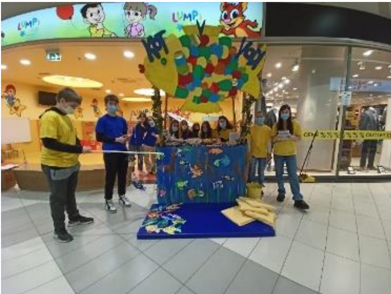
Slika 3: Prezentacija na tržnici

Svi članovi su međusobno surađivali, nadopunjavali se i javno nastupali te tako razvijali svoje samopouzdanje.