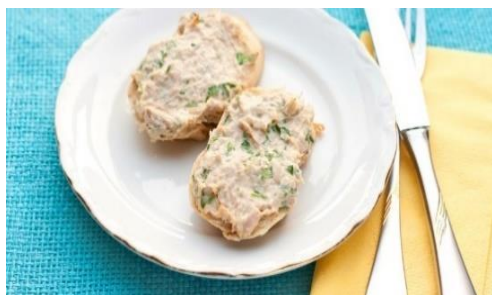
Slika 6: Riblji namaz

17. 30 – zahvala i završetak te odlazak kući (pješice ili besplatnim autobusom).