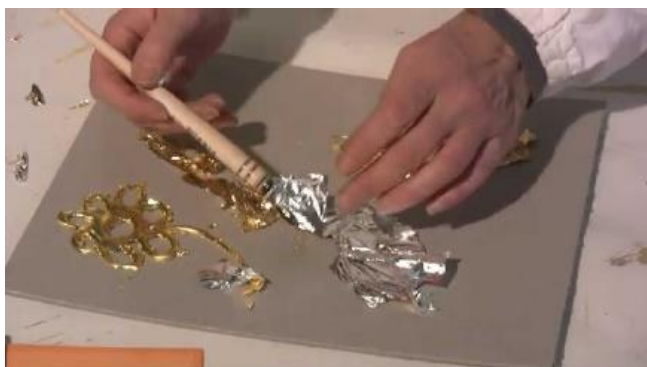
Slika 4: Izrada pozlate

20.00 – zahvala i završetak uz čašu vina za odrasle i prirodni sok za djecu u baru na Ranci.