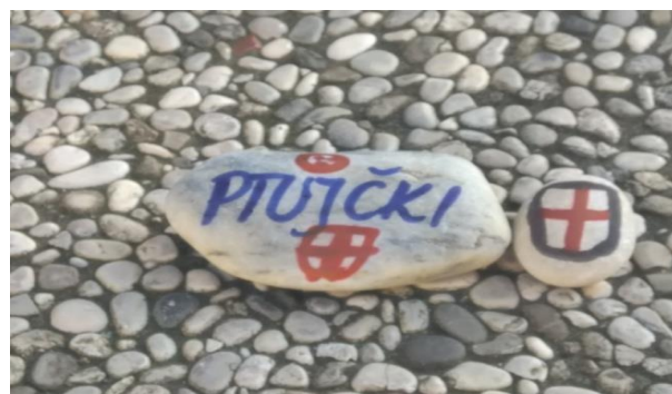
Slika 5: Ptujčki