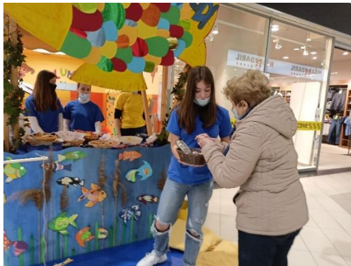
Slika 10: Prezentacija posjetiteljima

Učenici su pozivali goste na štand i predstavljali im svoj projekt, reklamni materijal, suvenire i druge proizvode. Svoj su projekt predstavili i stručnom povjerenstvu koje je njihov projekt ocijenilo. Dobili su zlatnu nagradu.