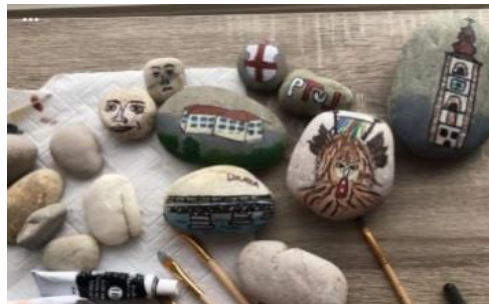
Slika 7 : Ptujčki