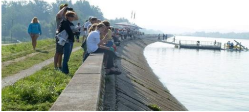
Slika 8: Šetnja uz jezero

17. 30 – prezentacija blatnih kupki i obloga tijela, masaža toplim dravskim kamenjem i kratke vježbe opuštanja, 19.00 – večera na Ranci, 20.00 – vožnja brodom iz Rance do termi, 20.30 – večernje druženje uz vatru (pečenje kobasica, pjenastih bombona i krumpira) ili uživanje u termama, 22.30 – spavanje u bungalovima ili organizirani prijevoz do seoskog gospodarstva Čeh u Podvincima: