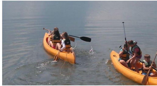
Slika 9: Veslanje po Ptujskom jezeru