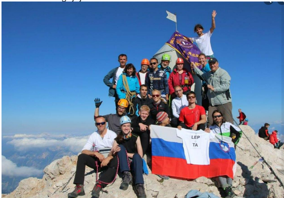
Slika 6. (M. Hribar): Grupna fotografija učenika i pratitelja sa slovenskom zastavom, »praporom« odnosno zastavom Lions districta, majicom s natpisom SLJEPOČA NIJE PREPREKA i Aljaževim stupom u pozadini.

Na vrh smo stigli oko 10 sati ujutro. Uslijedili su glasni usklici veselja, suze radosnice i radosni zagrljaji.