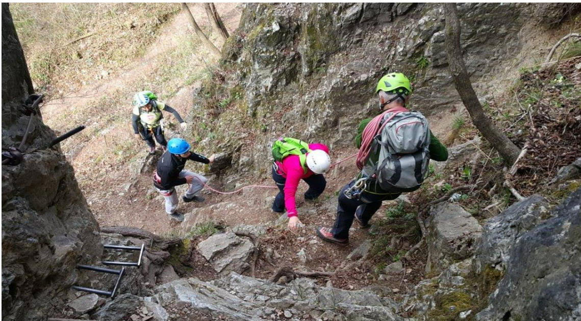
Slika 3. (G. Tanšek): Kretanje vodiča i slijepih srednjoškolaca uz primjenu užeta za penjanje pri usponu na Šmarnu goru.