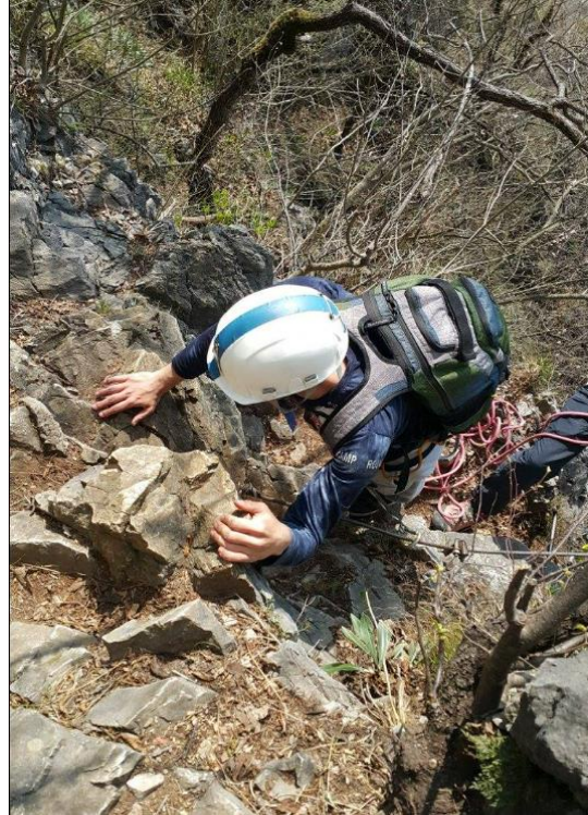
Slika 1. (G. Tanšek): Uspon na Šmarnu goru Pogačnikovim putem.