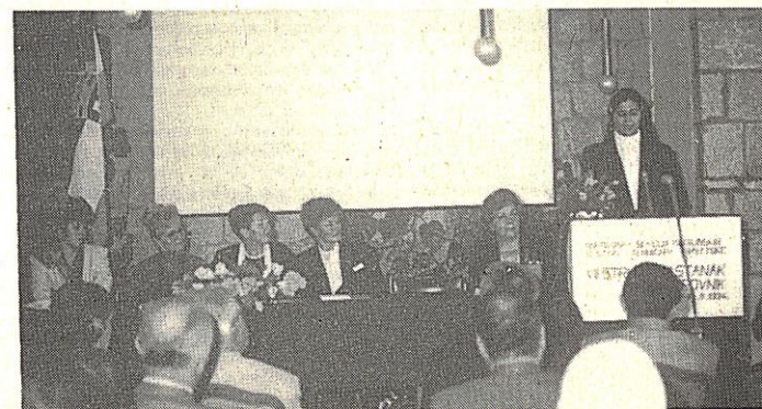
Zanimljiva rasprava, mnoštvo preporuka