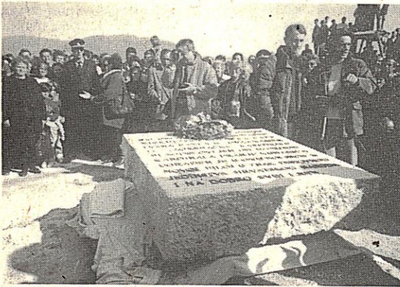
Kamen temeljac za novu bolnicu u Novoj Bili

maknuti za slijedeći dan. Naime, to popodne bio je koncert »Parnog valjka« u Novom Travniku, koji se nije smio produžiti iza 19 sati kada je počinjao policijski sat. I još nešto važno – stanovnici Novog Travnika za vrijeme našeg boravka bili su pošteđeni redukcije električne energije.