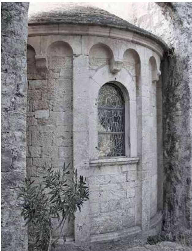
7 Crkva sv. Marije, apsida Church of St. Mary, apse

nadopunio ranije stavove iznesene 1949. godine. 52 Spomenuti radovi, posebice oni iz 1949. i 1958. godine, i danas su temeljna djela za svako daljnje izučavanje i razumijevanje te iznimne graditeljske cjeline. Sagledavajući Fiskovićev doprinos u istraživanju ovoga spomenika, u prvom redu valja istaknuti njegovu interpretaciju i valorizaciju crkve sv. Marije na Mljetu, jer je riječ o zaista izvanrednom primjeru srednjovjekovnog graditeljstva nastalom oko 1200. godine. U tom pogledu nužno je naglasiti kako je mljetsko zdanje jedinstven primjer romaničke benediktinske crkve s kupolom na našoj strani Jadrana, a riječ je i o jedinog sačuvanoj reprezentativnoj romaničkoj građevini na širem dubrovačkom prostoru. Stoga je Sv. Marija od izrazite važnosti za razumijevanje onodobne graditeljske baštine istočnoga Jadrana, a osobito dubrovačkoga kraja. Zahvaljujući upravo Fiskovićevu istraživanju definiran je prvotni izgled benediktinske crkve, napose njezina jednobrodna osnova s kupolom nad središnjim dijelom, potom složeno trodijelno svetište, zatim tri bočna portala te naposljetku vanjsko oblikovanje apsida i zapadnog pročelja. Dokazavši da sakralna građevina izvorno nije bila križnoga tlocrta, kako je to prethodno mislio Ljubo Karaman, Fisković je odbacio i Karamanovu pretpostavku o povezanosti Sv. Marije s raškim