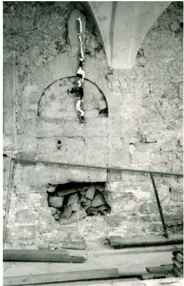
14 Zapadna samostanska zgrada, portal romaničkog samostana (foto: MKM, KO-ST, inv. br. 5426, 1950.)

Western monastery building, portal of the Romanesque monastery (Ministry of Culture and Media, Conservation Department in Split, inv. no. 5426, 1950)