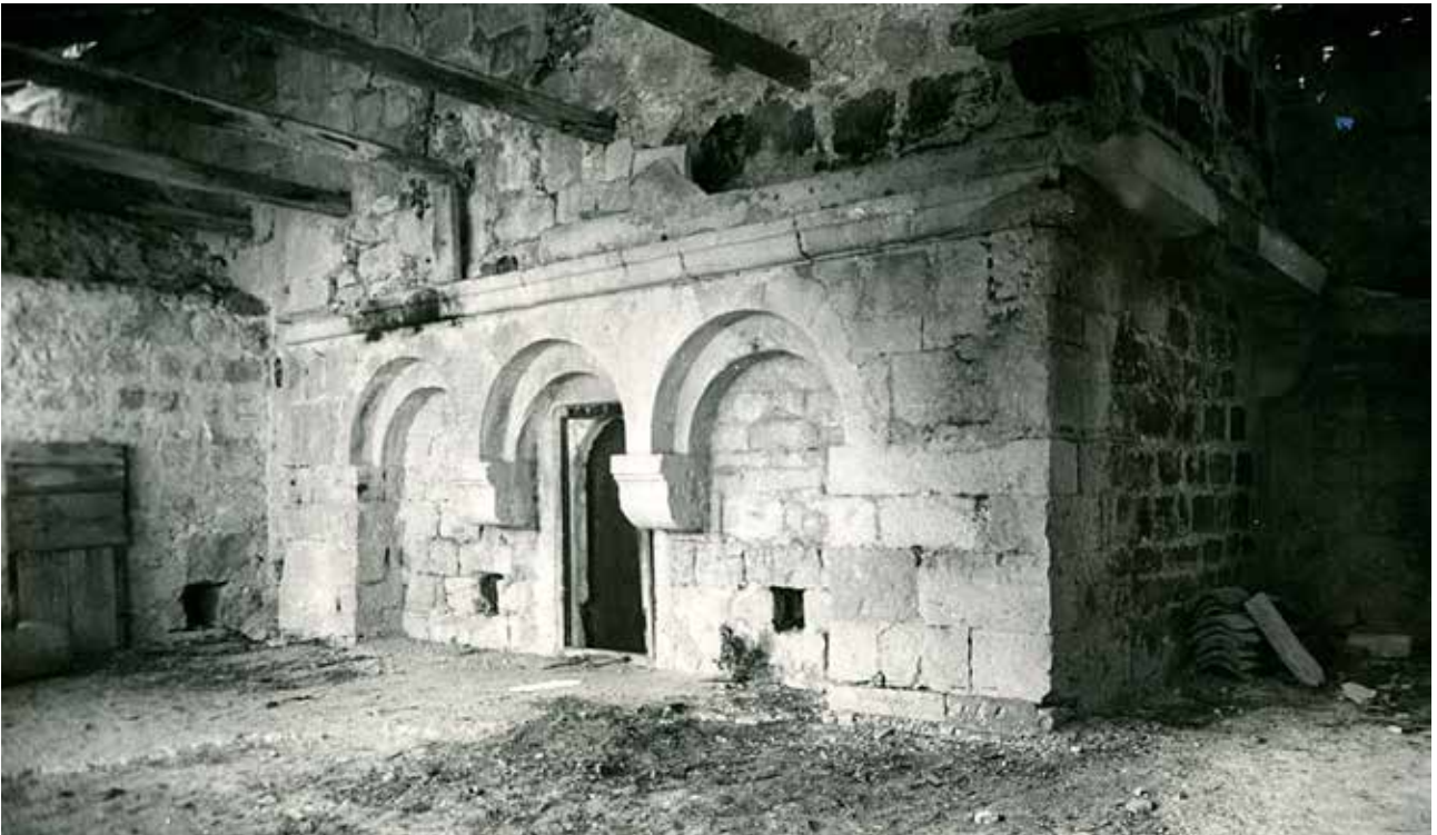
4 Crkva sv. Marije, južna strana, prije obnove (inv. br. 5372, 1948.)

Church of St. Mary, south side, before restoration (inv. no. 5372, 1948)