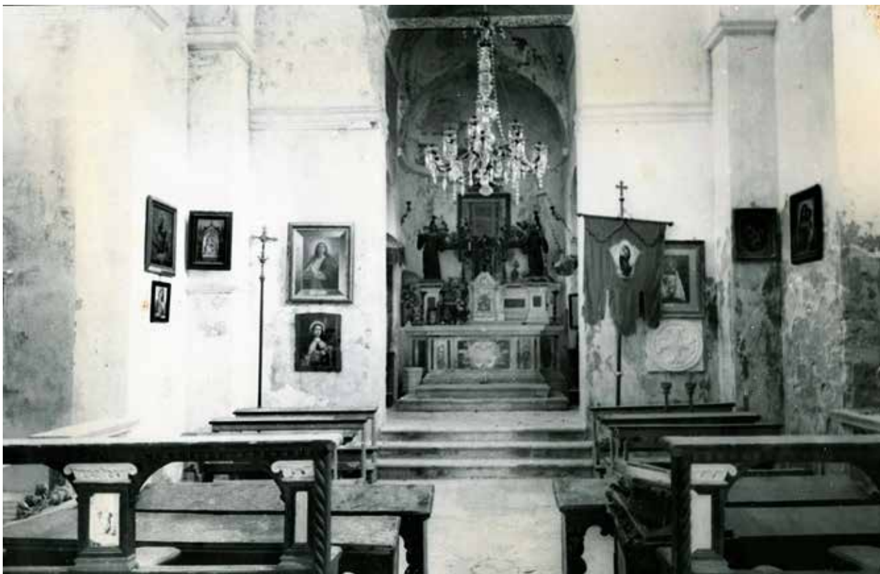
10 Crkva sv. Marije, svetište, prije obnove (foto: MKM, KO-ST, inv. br. 5331, 1948.)

Church of St. Mary, chancel, before restoration (Ministry of Culture and Media, Conservation Department in Split, inv. no. 5331, 1948)