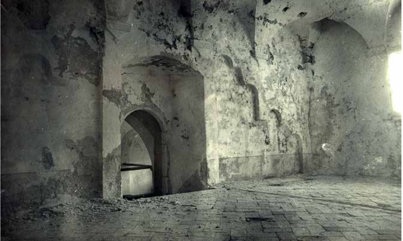
8 Crkva sv. Marije, ostatci zapadnog pročelja, prije obnove (foto: MKM, KO-ST, inv. br. 5348, 1948.)

Church of St. Mary, the remains of the western facade, before restoration (Ministry of Culture and Media, Conservation Department in Split, inv. no. 5348, 1948)