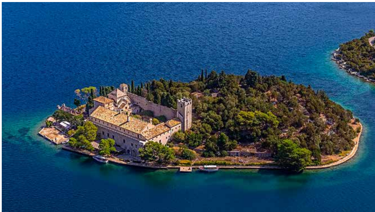
1 Samostanski sklop na otočiću Sv. Marije, otok Mljet, zračna snimka

Monastery complex on the island of St. Mary, island of Mljet, aerial view