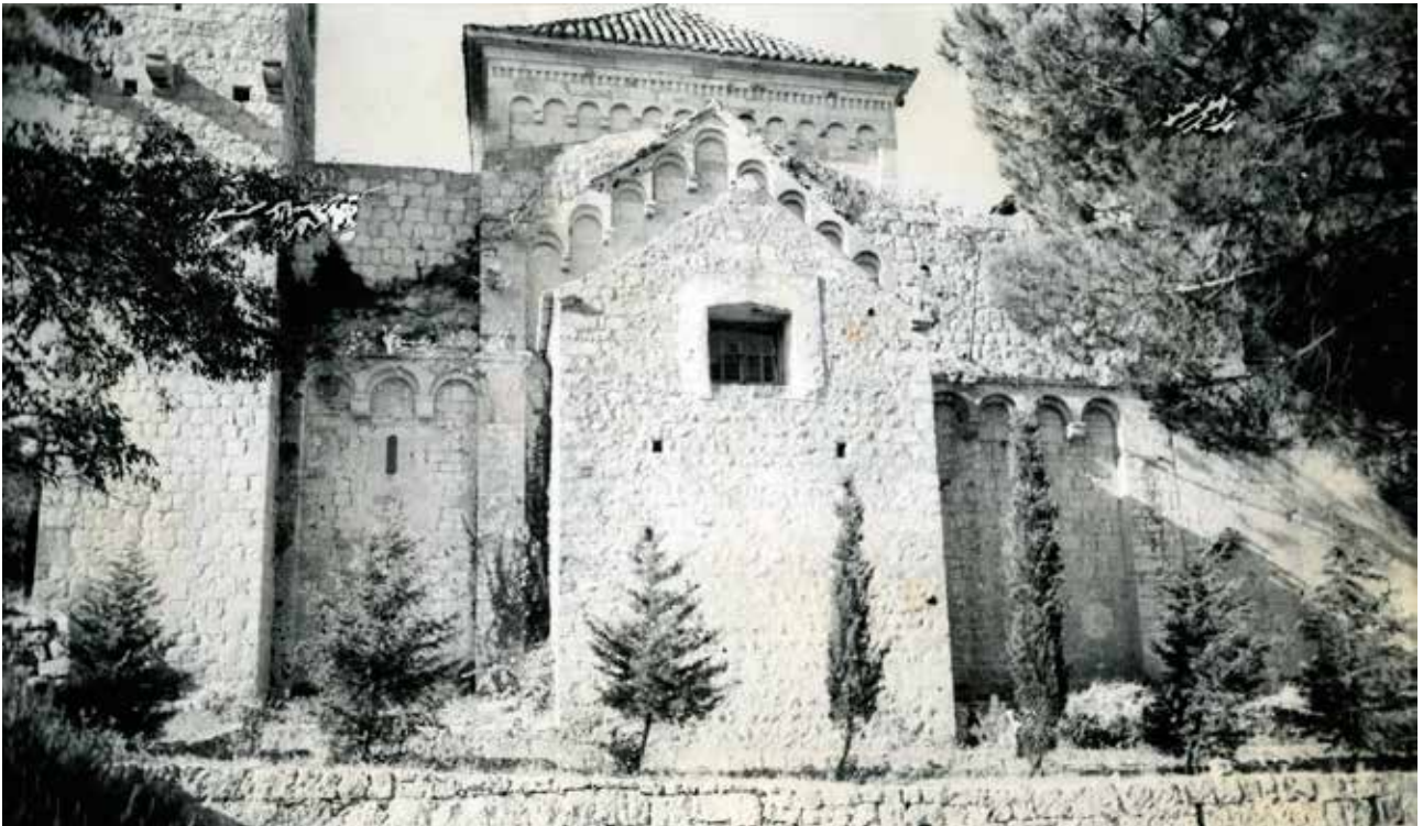
5 Samostanski sklop, sjeverna strana, prije obnove (foto: MKM, KO-ST, inv. br. 5335, 1948.)

Monastery complex, north side, before restoration (Ministry of Culture and Media, Conservation Department in Split, inv. no. 5335, 1948)