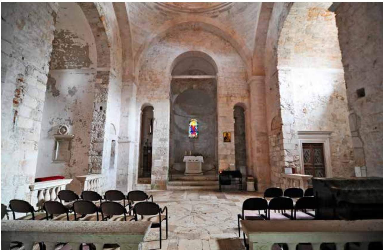
12 Crkva sv. Marije, svetište i središnji travaj s baroknim kapelama Church of St. Mary, the chancel and the central bay with Baroque chapels