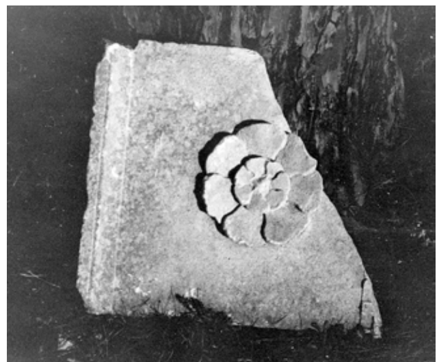
15 Ulomak renesansne propovjedaonice (foto: MKM, KO-ST, inv. br. 6228, 1958.)

Western monastery building, portal of the Romanesque monastery (Ministry of Culture and Media, Conservation Department in Split, inv. no. 5426, 1950)