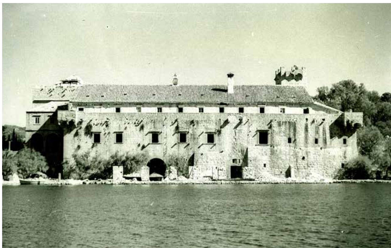
13 Samostanski sklop, zapadna strana, prije obnove (foto: Ministarstvo kulture i medija, Konzervatorski odjel u Splitu, inv. br. 5350, 1948.) Monastery complex, west side, before restoration (Ministry of Culture and Media, Conservation Department in Split, inv. no. 5350, 1948)