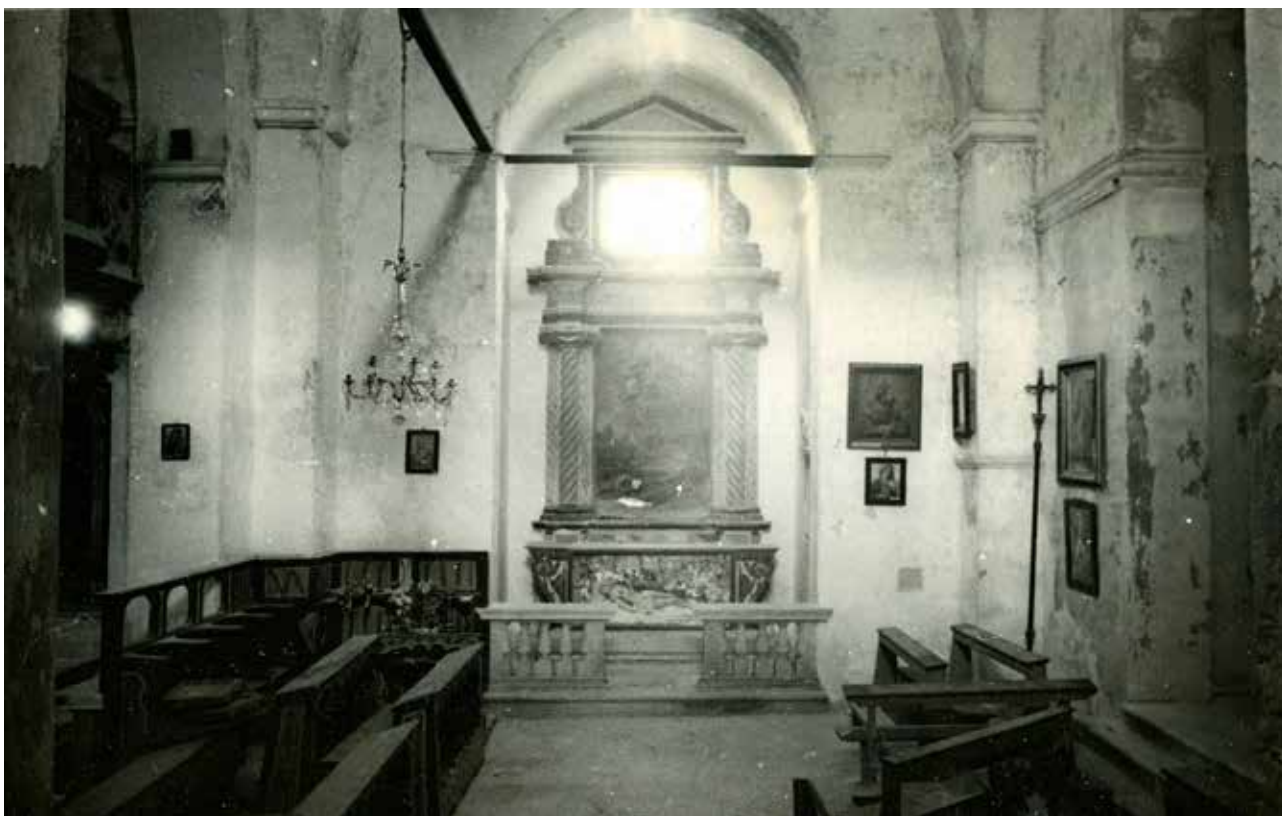
11 Crkva sv. Marije, sjeverna kapela, prije obnove (foto: MKM, KO-ST, inv. br. 5343, 1948.)

Church of St. Mary, chancel, before restoration (Ministry of Culture and Media, Conservation Department in Split, inv. no. 5331, 1948)