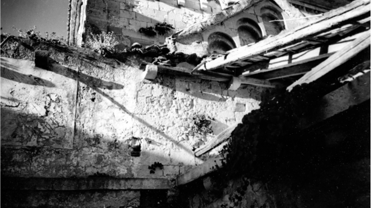
2 Samostanski sklop, južna strana, prije obnove (foto: MKM, KO-ST, inv. br. 5334, 1948.)

Monastery complex, south side, before restoration (Ministry of Culture and Media, Conservation Department in Split, inv. no. 5334, 1948)