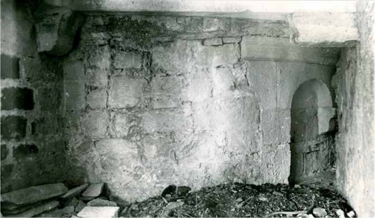
6 Crkva sv. Marije, apsida, jugoistočna strana, prije obnove (foto: MKM, KO-ST, inv. br. 5347, 1948.)

Church of St. Mary, apse, southeast side, before restoration (Ministry of Culture and Media, Conservation Department in Split, inv. no. 5347, 1948)