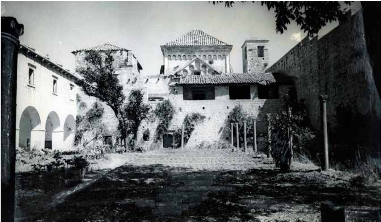
3 Crkva sv. Marije, južna strana, prije obnove (foto: MKM, KO-ST, inv. br. 5393, 1948.)

Church of St. Mary, south side, before restoration (Ministry of Culture and Media, Conservation Department in Split, inv. no. 5393, 1948)