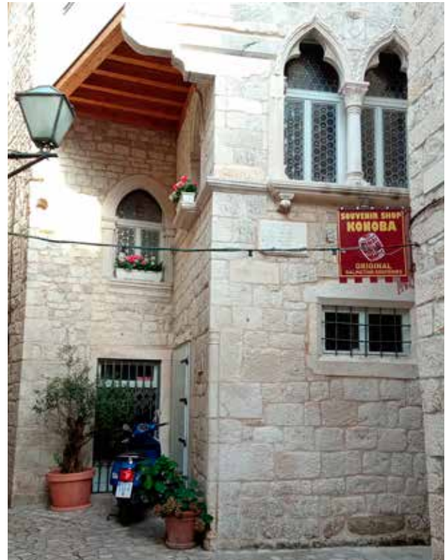
7 Ugaoni stup na kući Berislavić u Trogiru

Main façade of the Dominis palace in Rab and its corner column