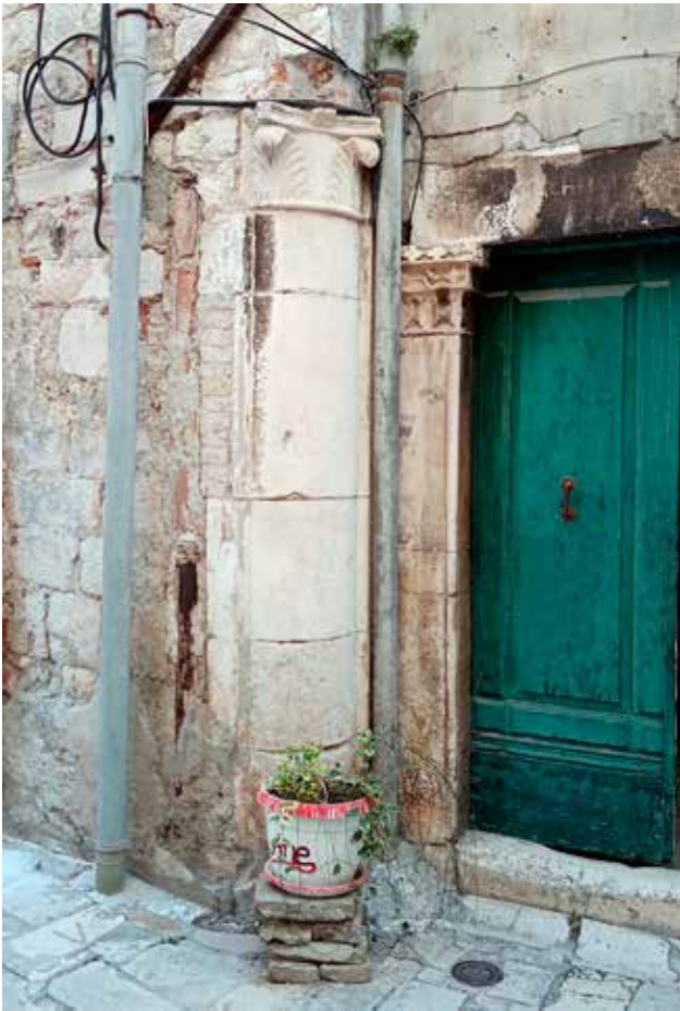
19 Ugaoni stup na kući u Ulici Svetog Nikole Tavelića 3 (foto: I. Glavaš, 2022.)

Corner column on the house at 3 Ulica Svetog Nikole Tavelića (photo: I. Glavaš, 2022)