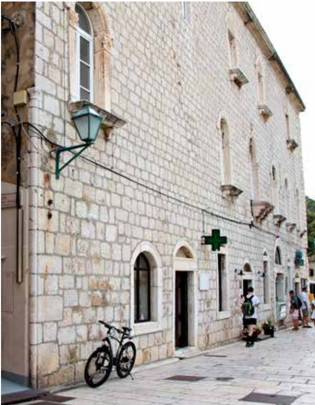
6 Glavno pročelje palače Dominis u Rabu i ugaoni stup

Main façade of the Dominis palace in Rab and its corner column