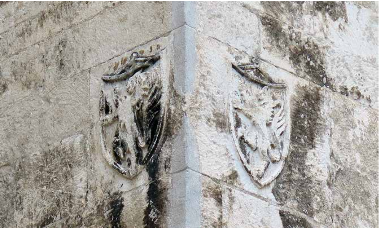
3 Zrcaljeni grbovi splitske plemićke obitelji de Ciprianis na uglu palače Ciprianis-Benedetti Mirrored coats of arms of the Split noble family de Ciprianis on the corner of the Ciprianis-Benedetti palace

(tadašnji korčulanski knez). 11 U visini prvog kata palače, a iznad ugaonog štapa, na obje strane pročelja zrcalno su postavljena dva grba obitelji de Ciprianis u gotičkom štitu (sl. 3). Ranija romanička faza objekta naglašena je rekonstruiranim heksaforama u razini prvog kata i ostacima dućanskih otvora u prizemlju građevine. S obzirom na to da je jedini vidljivi reprezentativni dio palače zapravo ugao (romaničke heksafore su također orijentirane prema uglu), logično je da se Ciprijan Zaninov odlučio da težište dekoracije i simbola svoje plemićke obitelji postavi na taj dio. Zato je obiteljske grbove zrcalno pozicionirao točno u osi ugaonog štapa. Kasniji vlasnici, obitelj Benedetti, postavljaju novi portal i svoj obiteljski grb na južnom pročelju u današnjoj Ulici Marka Marulića, gdje je daleko manje vidljiv. Prema tome, ta koncepcija Ciprijana Zaninova možda bi mogla predstavljati najstarije datirano povezivanje ugaonog štapa i u uglu zrcaljeno postavljenih obiteljskih grbova. Međutim, ova koncepcija će svoj pravi procvat doživjeti u sljedećem stoljeću upravo u Šibeniku, s tim da treba naglasiti da završetak ugaonog štapa i vijenca na splitskoj palači Ciprianis-Benedetti i grbove obitelji de Ciprianis na prvom katu razdvajaju dva reda klesanog kamena, dok to u Šibeniku nije slučaj.