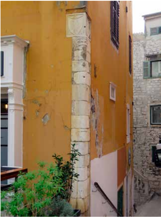
24 Ugaoni stup na kući u Ulici kralja Tomislava 9 Corner column on the house at 9 Ulica kralja Tomislava