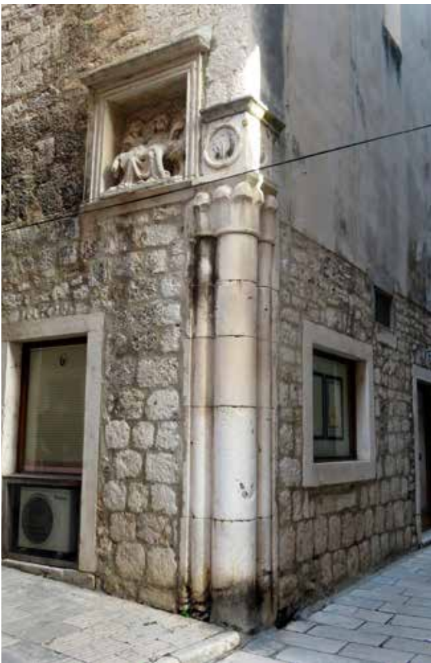
5 Ugaoni stup na uglu bratimske kuće bratovštine sv. Marije od Kaštela (foto: I. Glavaš, 2022.)

Map representing the locations of 15 corner columns in the historical centre of Šibenik (made by: I. Šprljan, 2022)