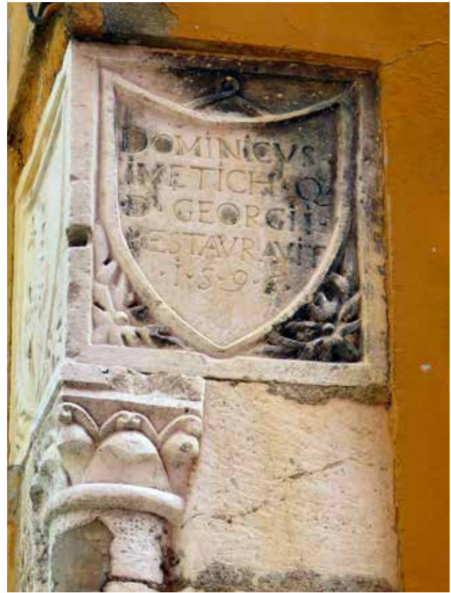
25 Detalj natpisa obitelji Ivetić na kući u Ulici kralja Tomislava 9 Detail of inscription on the house of the Ivetić family at 9 Ulica kralja Tomislava

drugom katu. 33 Budući da je kuća (kao i većina u šibenskoj povijesnoj jezgri) doživjela brojne preinake, praktički sve do suvremenog doba, bez detaljnog istraživanja gotovo je nemoguće govoriti o njezinim povijesnim fazama, prostornosti i katnosti. Kako je općenito stanje istraženosti kuća u povijesnoj jezgri Šibenika minimalno, to se mogu očekivati mjestimične nove pojave romaničkih detalja pa bi neki objekti za koje smo prethodno bili sigurni da nisu sagrađeni ranije od 15. stoljeća mogli biti bitno stariji. 34