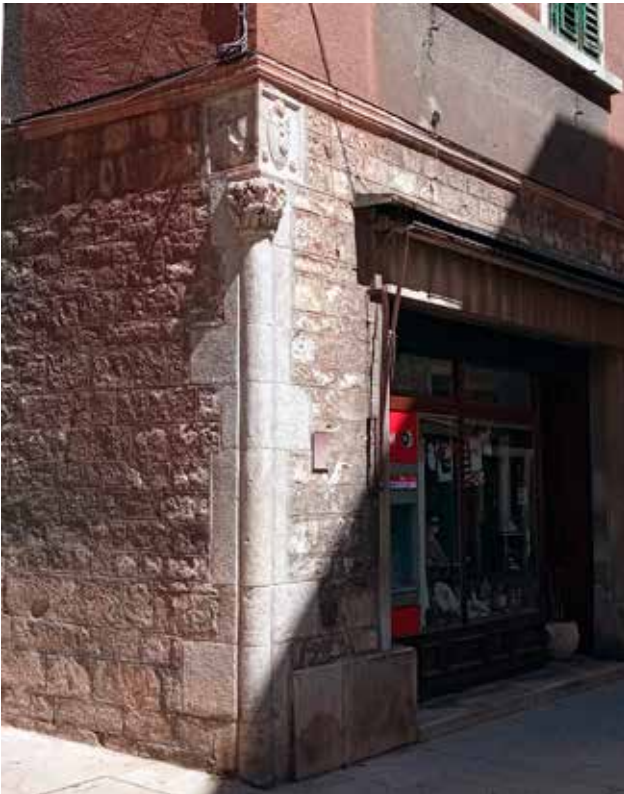
17 Ugaoni stup na kući u Zagrebačkoj ulici 8 Corner column on the house at 8 Zagrebačka ulica