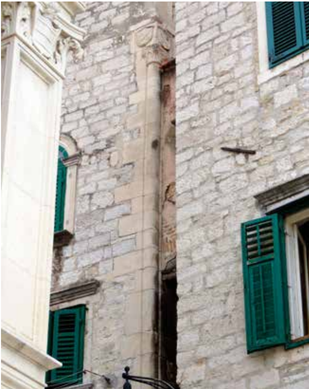
8 Ugaoni stup na palači Divnić Corner column on the Divnić palace