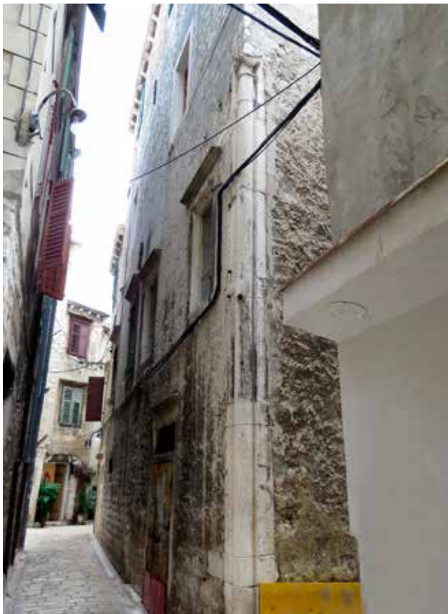
13 Ugaoni stup na kući u Ulici Jurja Barakovića 1 Corner column on the house at 1 Ulica Jurja Barakovića