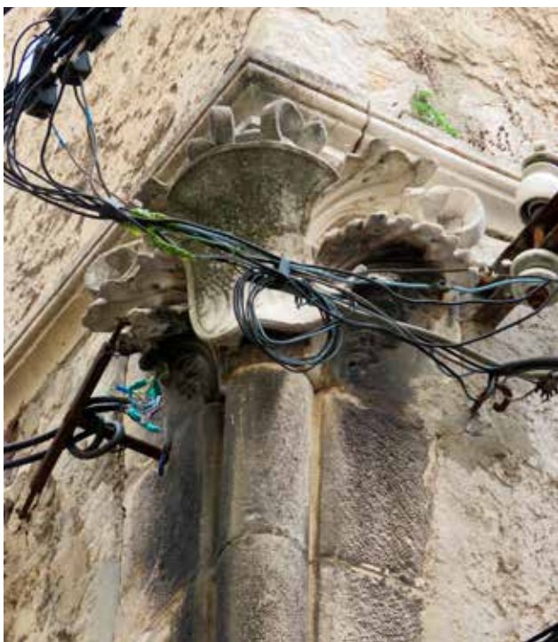
15 Obiteljski grb unutar kapitela stupa na kući u Ulici kralja Tomislava 5B Family coat of arms on the capital of the column at 5B Ulica kralja Tomislava