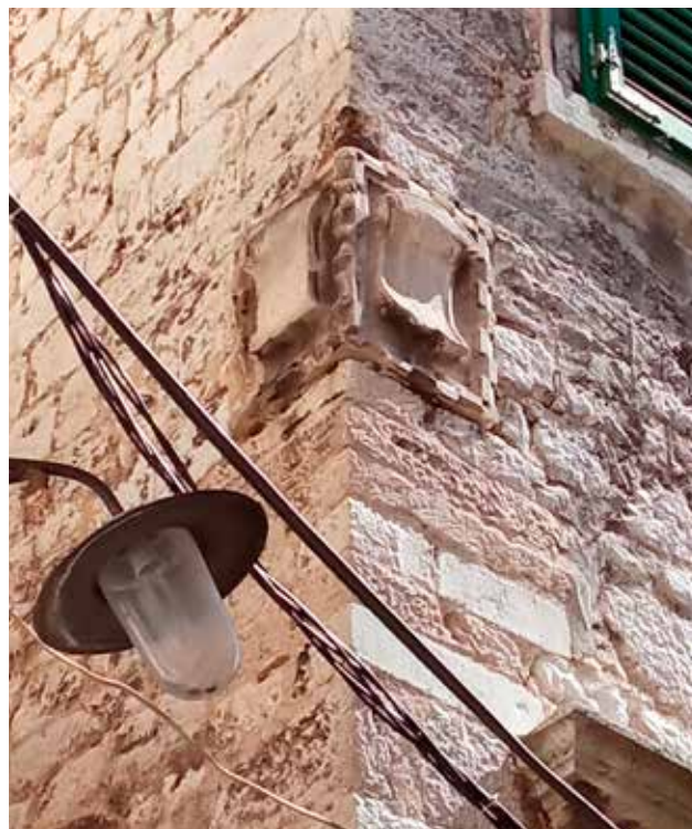
27 Obiteljski grbovi na kući na križanju Ulice Svetog Nikole Tavelića i Ulice 15. siječnja 1873. Family coats of arms on the house on the crossing of Ulica Svetog Nikole Tavelića and Ulica 15. siječnja 1873

Narodnom trgu u Splitu. Na samom uglu te palače u visini prvog kata, a iznad ugaonog štapa koji ide sve do završetka prizemlja, zrcaljeno su postavljeni grbovi splitske plemićke obitelji de Ciprianis u gotičkom štitu. Palača Ciprianis-Benedetti od romanike (romaničke heksafore) do gotike orijentirana je uglom prema Narodnom trgu, stoga je pozicija ugaonog stupa i plemićkih grbova kao pokazivanja moći vrlo logična. Kako je stambeno graditeljstvo u povijesnoj jezgri Šibenika još uvijek nedovoljno istraženo, tek ćemo nakon nekih budućih terenskih i arhivskih istraživanja možda moći nešto više kazati o tome jesu li ugaoni stupovi na nekim objektima u Šibeniku ujedno i orijentir za njihovu dataciju. Pritom svakako treba imati na umu da je vrlo mali broj dekorativnih elemenata na pročeljima kuća i palača u dalmatinskim komunama danas na svom izvornom mjestu, što predstavlja najveću teškoću kod identifikacije pojedinih umjetničkih tragova na pročeljima. U svakom slučaju, prema stilskim karakteristikama ugaoni stupovi uklapaju se u intenzivnu izgradnju povijesne jezgre Šibenika u 15. stoljeću.