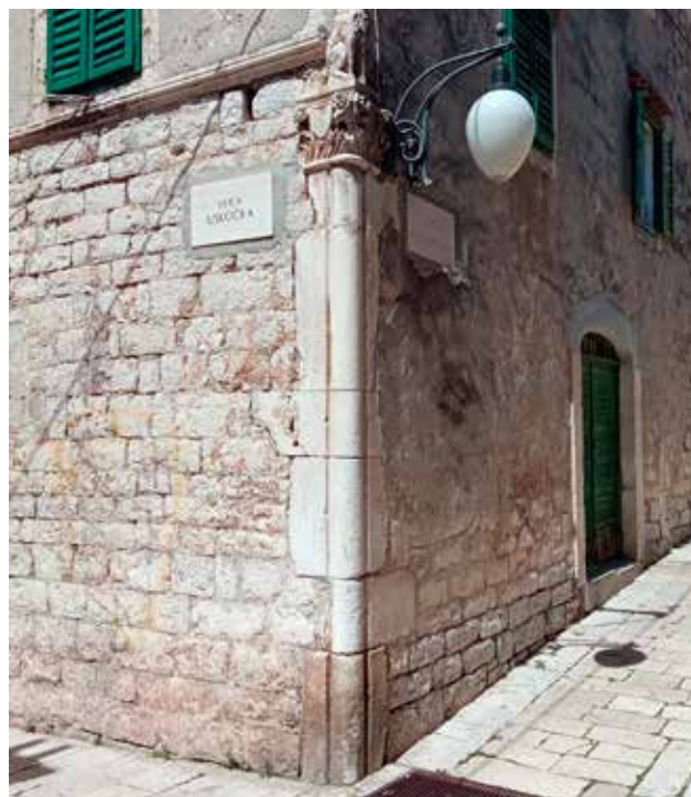
16 Ugaoni stup na kući u Uskočkoj ulici 2 Corner column on the house at 2 Uskočka ulica