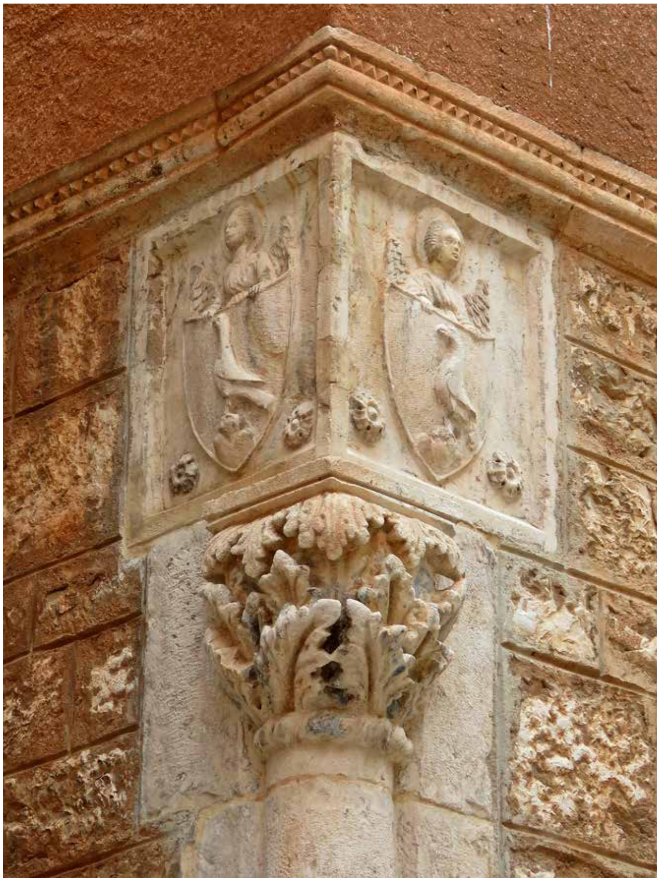
23 Obiteljski grbovi iznad ugaonog stupa u Zagrebačkoj ulici 8