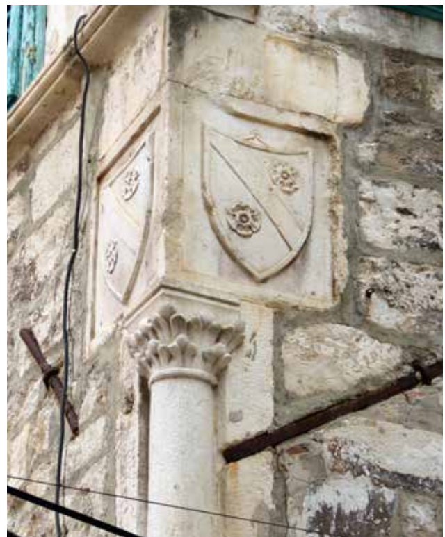
12 Grbovi plemićke obitelji Divnić iznad ugaonog stupa na kući u Ulici kralja Tomislava 16 Coats of arms of the noble family Divnić above the corner column on the house at 16 Ulica kralja Tomislava

Izraziti primjeri lociranja ugaonih stupova u odnosu na reprezentativnu etažu i ugaone bifore dvije su nasuprotno