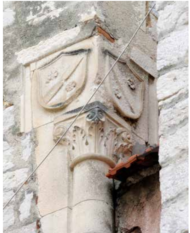
9 Grbovi plemićke obitelji Divnić iznad ugaonog stupa palače Divnić

Coats of arms of the noble family Divnić above the corner column of the Divnić palace