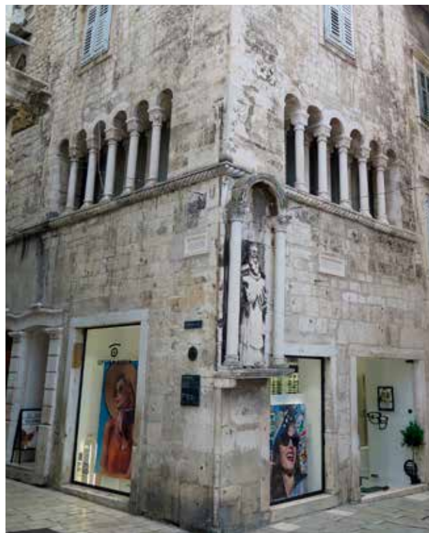
2 Ugao palače Ciprianis-Benedetti u Splitu Corner on the Ciprianis-Benedetti palace in Split

Trogiru (sačuvalo ih se sedam) daje Ana Plosnić Škarić u svom neobjavljenom doktorskom radu iz 2010. godine. 6 U novije vrijeme ugaonim stupovima na Rabu, gdje ih je poslije Šibenika i najveći broj, bavi se Marija Bijelić koja u radu objavljenom u Peristilu 2017. godine donosi i kartu postojećih stupova u povijesnoj jezgri Raba. 7 Laris Borić i Jasenka Gudelj u svojoj knjizi o Cresu objavljenoj 2019. godine komentiraju nekoliko postojećih ugaonih stupova u povijesnoj jezgri Cresa u kontekstu obrade stambenih objekata. 8 Stoga je, s obzirom na stanje istraživanja fenomena, cilj ovoga rada pobliže objasniti pitanje ugaonih stupova u Šibeniku, posebno s obzirom na njihovo značenje u kontekstu nagle izgradnje grada tijekom 15. stoljeća. Komparativnom analizom utvrdit će se osobite značajke ugaonih stupova u Šibeniku u odnosu na druga mjesta na istočnoj jadranskoj obali gdje se javljaju.