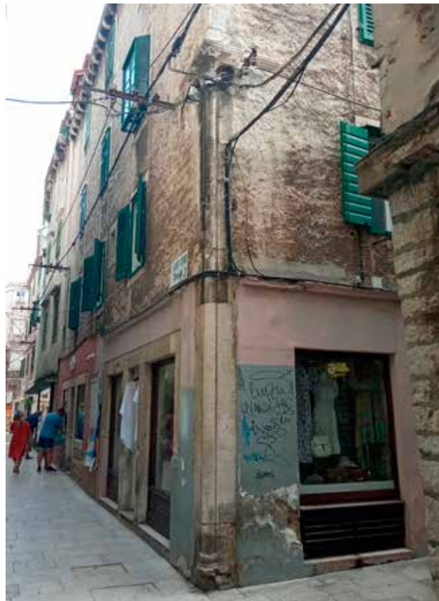
14 Ugaoni stup na kući u Ulici kralja Tomislava 5B (foto: I. Glavaš, 2022.) Corner column on the house at 5B Ulica kralja Tomislava (photo: I. Glavaš, 2022)