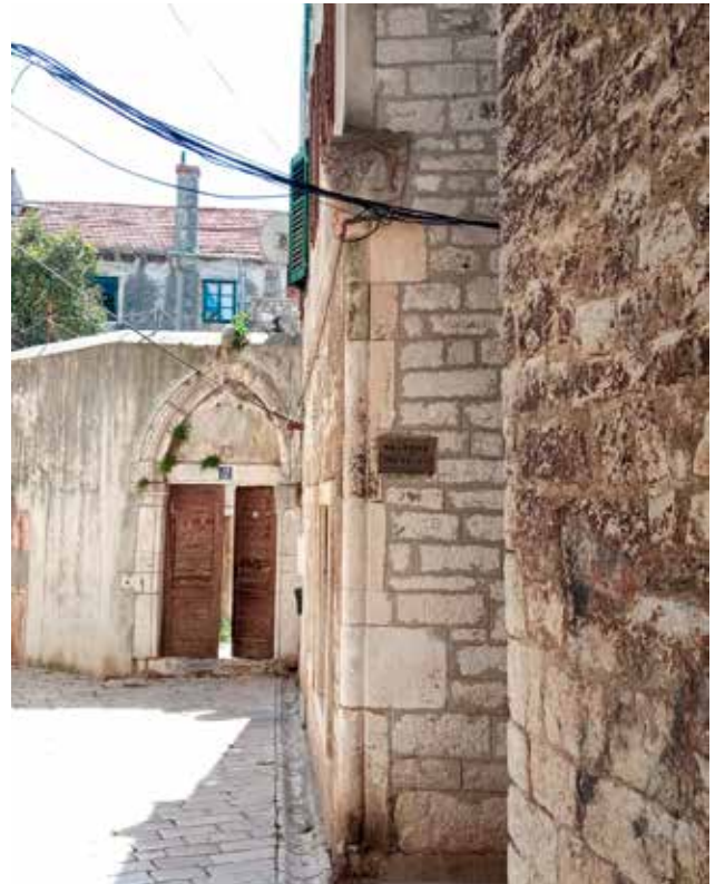
18 Ugaoni stup na kući u Ulici Svetog Nikole Tavelića 10A Corner column on the house at 10A Ulica Svetog Nikole Tavelića