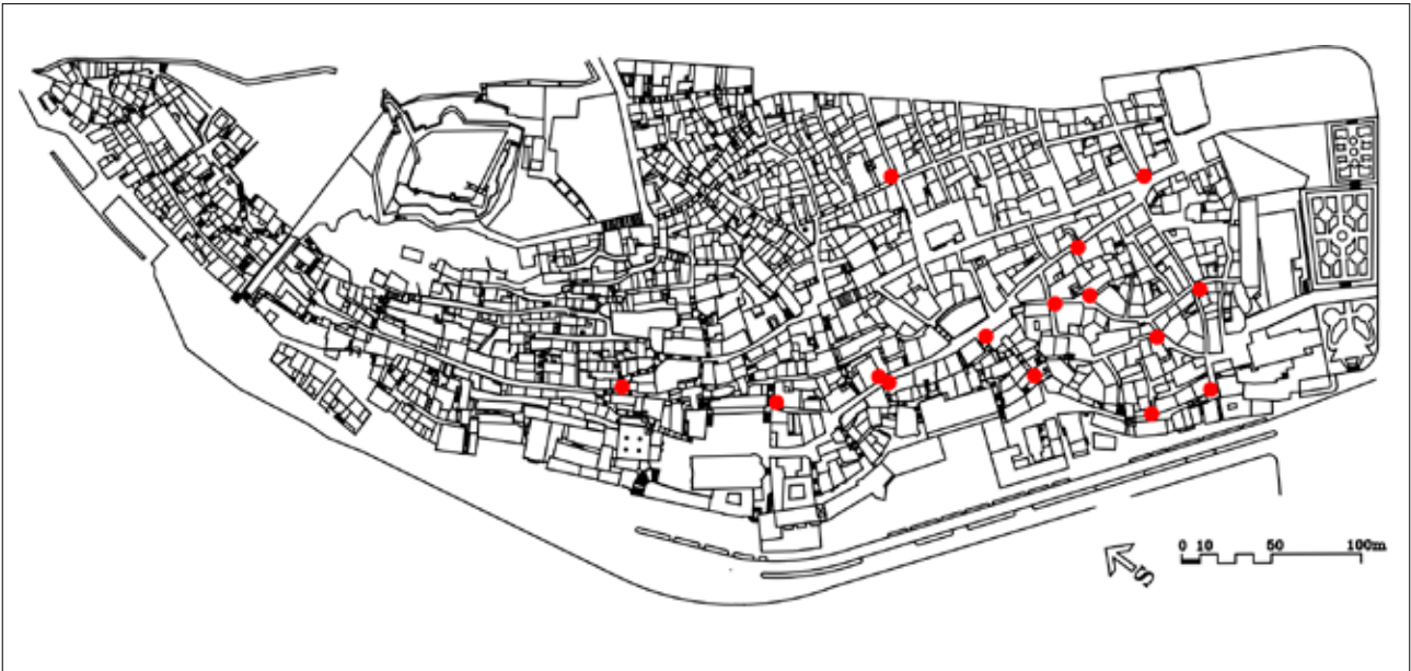
4 Karta 15 ugaonih stupova u povijesnoj jezgri Šibenika (izradio: I. Šprljan, 2022.)

Map representing the locations of 15 corner columns in the historical centre of Šibenik (made by: I. Šprljan, 2022)