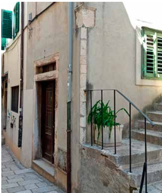
26 Ugaoni stup na kući u Uskočkoj ulici 10 Corner column on the house at 10 Uskočka ulica