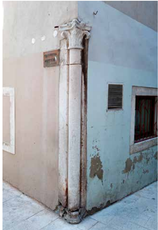
20 Ugaoni stup na kući u Ulici Jurja Šižgorića 5

Corner column on the house at 3 Ulica Svetog Nikole Tavelića