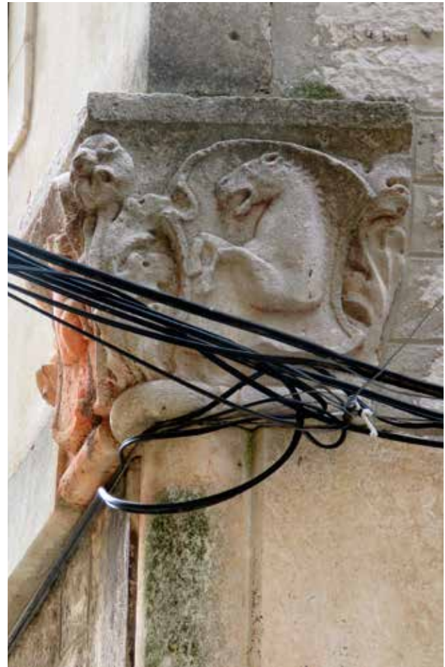
22 Obiteljski grb unutar kapitela stupa u Ulici Svetog Nikole Tavelića 10A

Family coats of arms decorating column capitals from the house at 2 Uskočka ulica