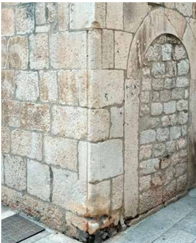
1 Ugaoni štap u Trogiru (foto: I. Glavaš, 2022.) Corner pole in Trogir (photo: I. Glavaš, 2022)