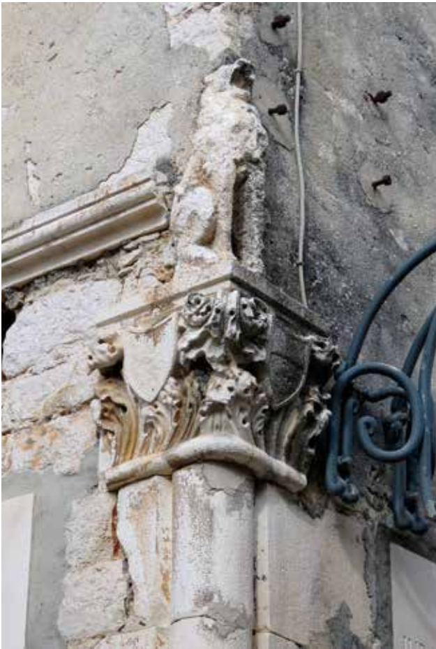
21 Otučeni obiteljski grbovi unutar kapitela stupa u Uskočkoj ulici 2

Family coats of arms decorating column capitals from the house at 2 Uskočka ulica