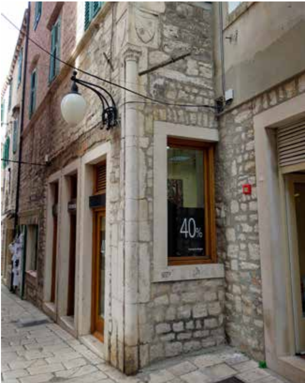
10 Ugaoni stup na kući u Ulici kralja Tomislava 16 Corner column on the house at 16 Ulica kralja Tomislava