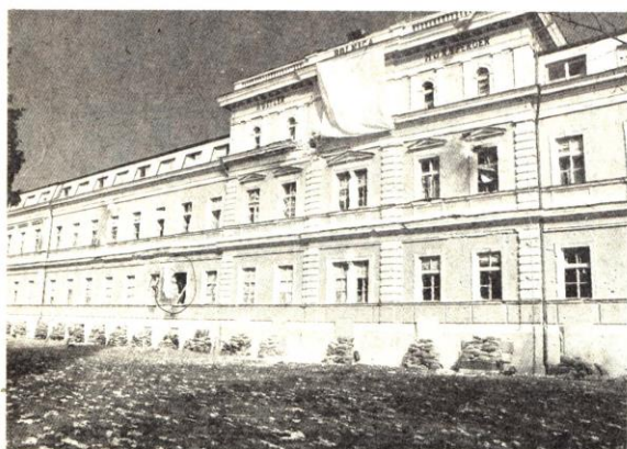
Interna klinika - neposredan pogodak u gama kameru

U ovom prikazu vidljivo je bitno smanjenje posteljnog kapaciteta, koji smo morali optimalno koristiti, skraćujući standardnu prosječnu dužinu liječenja s 12 na 6 dana. Postoperativno stabilizirane bolesnike smo premještali u druge zdravstvene ustanove u Hrvatskoj ili u inozemstvo (Austrija, Mađarska, Njemačka), kako bismo oslobodili potelje za novi HITAN PRIJEM.