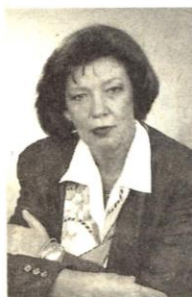
Napisala: Terezija FARKAŠ

• Veliku pomoć u obnašanju poslova medicinskih sestara i tehničara pružali su pripravnici kojih je bilo četrdeset • Bila su to djeca koja su preko noći postali ljudi, zapravo preozbiljni, savjesni, te nadasve stručni, djeca kroz čije je ruke prolazilo tisuće života. Bila su to djeca na čijim licima nije bio bezbrižan smješk, već zabrinutost jesu li dorasli postavljenim zadacima? Bila je to generacija mladih kojoj je ukradena mladost!