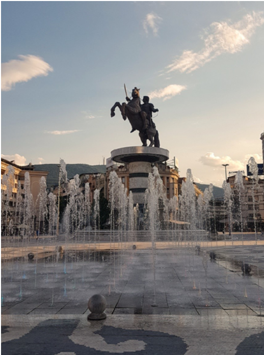
Glavni skopski trg

U Skopje sam se, međutim, vratila ljetos na dva tjedna kako bih pokupila ostatak stvari iz svog stana. Tu bih željela istaknuti da sam imala najdivnije gazde na svijetu koji mi nisu naplaćivali stanarinu od ožujka, kada sam napustila stan, do srpnja kada sam se ponovno vratila po ostatak stvari. S gazdama se i dalje čujem, a kako na ljeto planiram ponovni povratak u Skopje na nekoliko tjedana, veselimo se i ponovnom susretu. Tu vam još jednom potvrđujem kako su Makedonci jako ljubazni ljudi. Iako je moja razmjena zbog korone trajala svega sedam tjedana, bilo je to prekrasno iskustvo koje preporučujem svima. Ako mi je tih sedam tjedana bilo toliko lijepo mogu samo zamisliti kako bi izgledalo pet mjeseci.