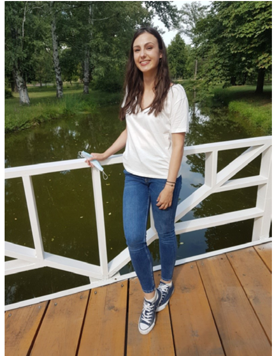
Skopski gradski park i ja