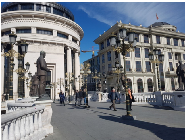
Arheološki muzej u centru Skopja