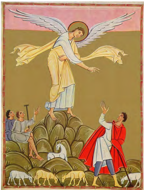
Slika 11. Navještenje pastirima, Perikope Henrika II. , 1007. ili 1012. godina, München, Bayerische Staatsbibliothek, f8v