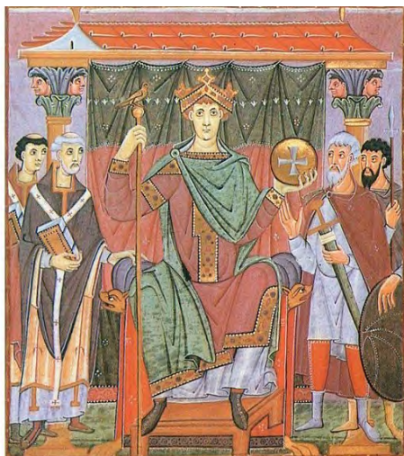
Slika 10. Imperator i njegove provincije, Evanđeljar Otona III. za katedralu u Bambergu , 997. – 1000. godine, München, Bayerische Staatsbibliothek, Clm 4453, f 23v–24r