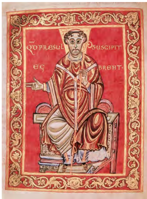
Slika 4. Prikaz trijerskog nadbiskupa Egberta, Egbertov psaltir , 977. – 993. godine, Cividale, Museo Archeologico, f. 17