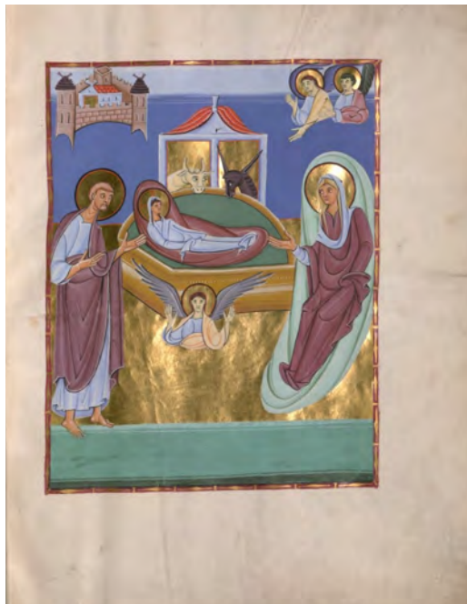
Slika 12. Rođenje Isusa, Perikope Henrika II. , 1007. ili 1012. godina, München, Bayerische Staatsbibliothek, BSB Clm 4452, 9r