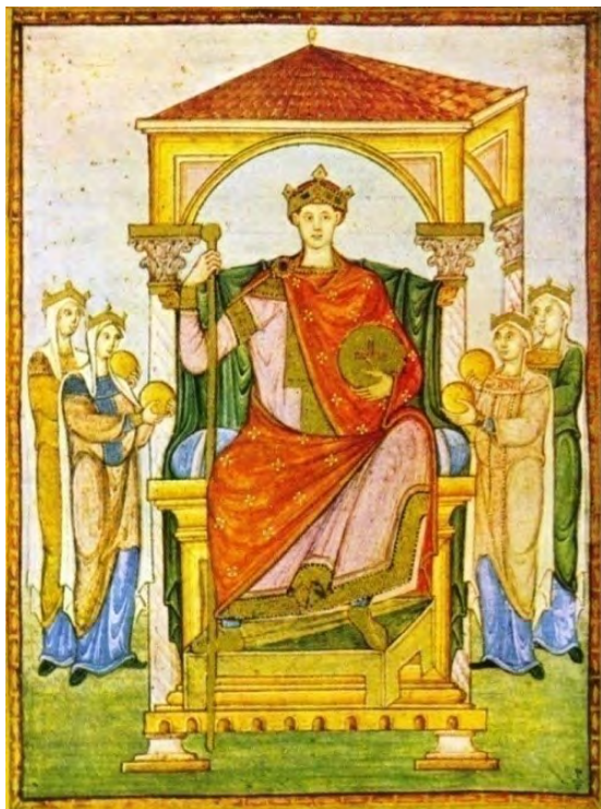
Slika 7. Car Oton II. ili III., Zbirka pisama pape Grgura Velikog , oko 983. godine, Chantilly, Musée Condé, Ms. 14 bis