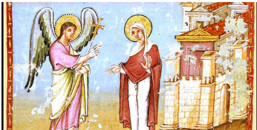
Slika 8. Navještenje, Egbertov kodeks , oko 985. godine, Trier, Stadtbibliothek Weberbach, Hs 24