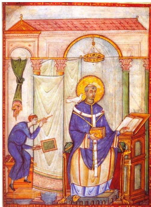
Slika 6. Papa Grgur nadahnut Duhom Svetim, Zbirka pisma pape Grgura Velikog , oko 983. godine, Trier, Stadtbibliothek, Ms. 171a