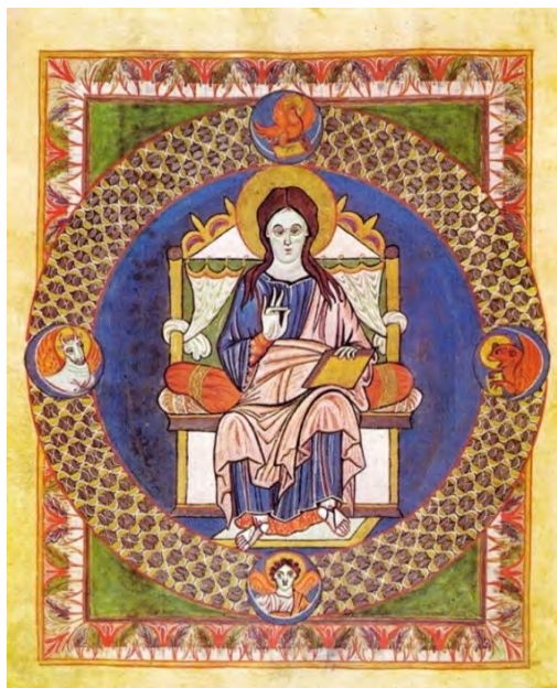
Slika 1. Krist u slavi, Gerov kodeks , prije 976. godine, Darmstadt, Landesbibliothek, Hs 1948, f. 5v