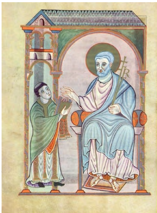
Slika 3. Gero poklanja kodeks Sv. Petru, Gerov kodeks , prije 976. godine, Darmstadt, Landesbibliothek, Hs 1948, 6v