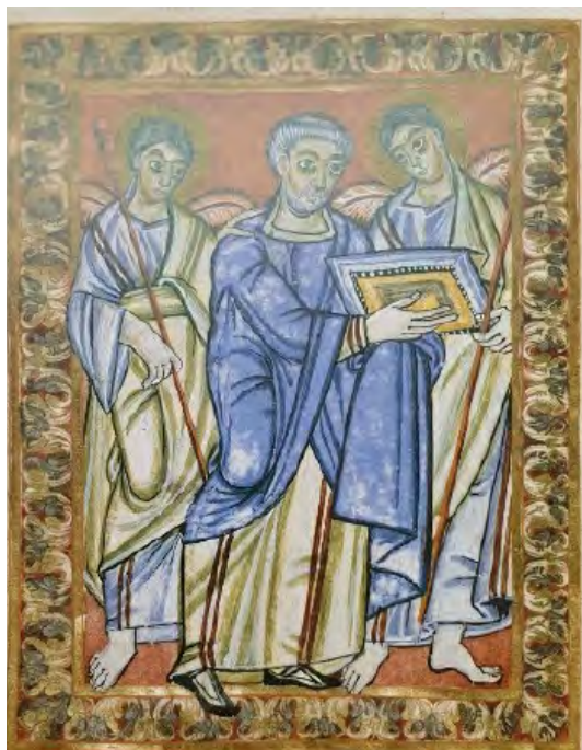
Slika 5. Donator s anđelima Gabrijelom i Mihaelom, Evanđelistar iz Poussaya , oko 980. godine, Pariz, Bibliothèque nationale de France, Lat 10514, f 3v