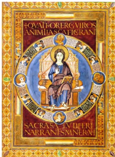
Slika 2. Krist u slavi, Evangelijar iz Lorscha , oko 810. godine, Alba Iulia, Rumunjska, Biblioteca Documentara Battyaneum, f72

(preuzeto s: http://tudigit.ulb.tu-darmstadt.de/show/Hs-1948/0011 pregledano 26. srpnja 2022.)