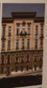
Velika trgovачka akademija Rijeka, Studentska ulica 2, 1899. godine Projektirao: Ignjari Alpar, 1899. godine

Hotel u Ulici Floridna u Quarilje Projektirao: Pavao Mladenić, 1911. godine A. PU-4-4452, 04