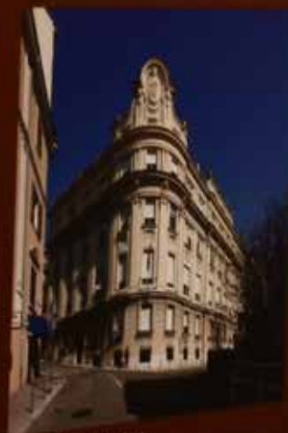
Pogled iz ulice Frana Kućeka

Kraljevićev trg, Rijeka, 2022. Institucija za promicanje umjetnosti, Zagreb. 2022.