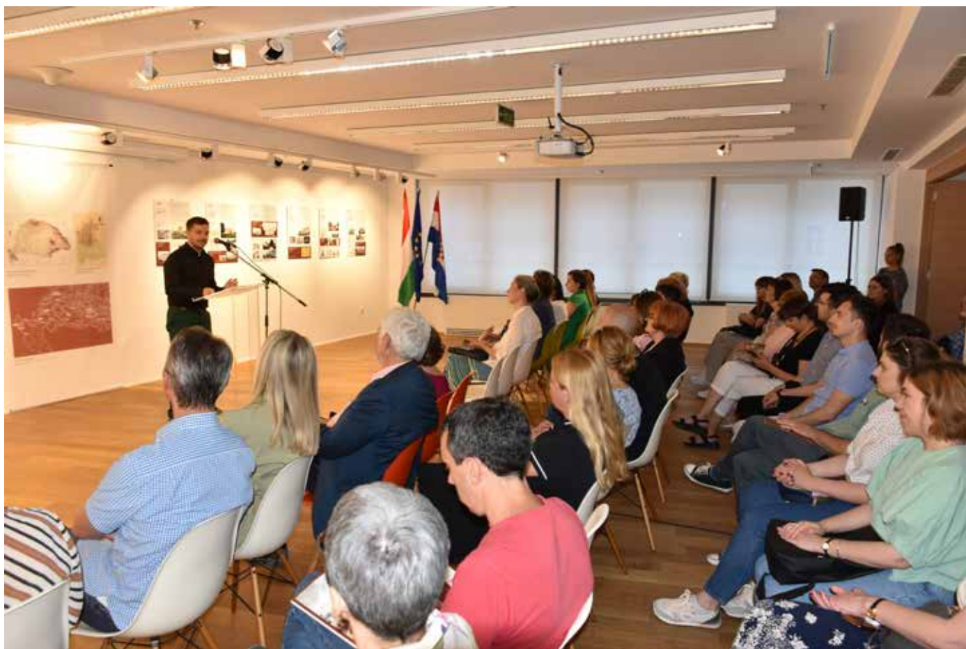
Otvorenje izložbe u Institutu Liszt – Mađarskom kulturnom centru Zagreb, lipanj 2022.