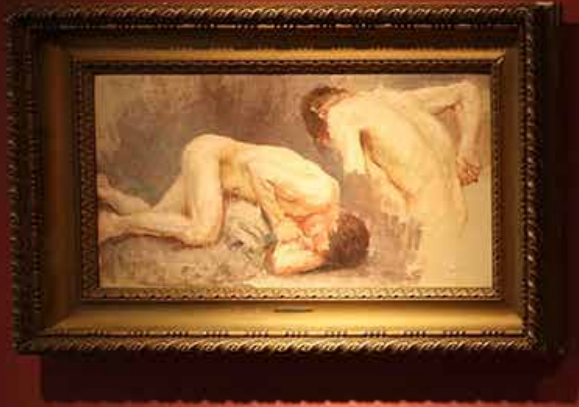
Two nude figures in a landscape by [illegible] [illegible]