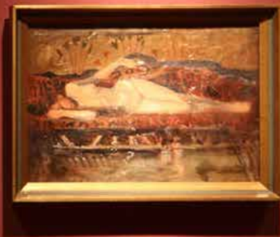
18. Jovanović, 1888 Nude figure lying on a bed Oil on canvas, 1888