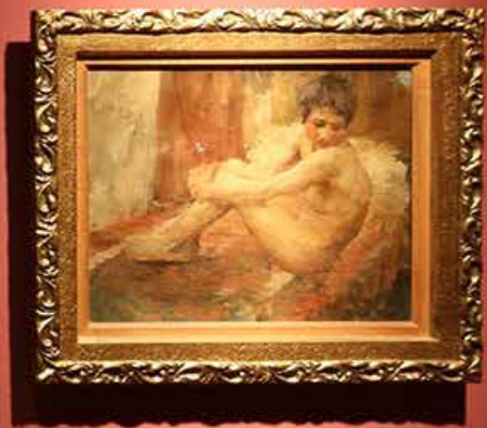
20. Jovanović, 1888 Nude figure sitting on a bed Oil on canvas, 1888