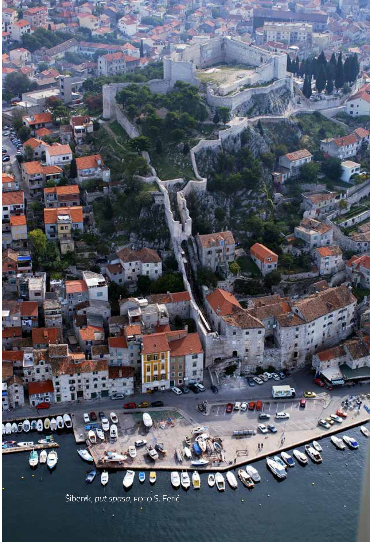
Šibenik, put spasa