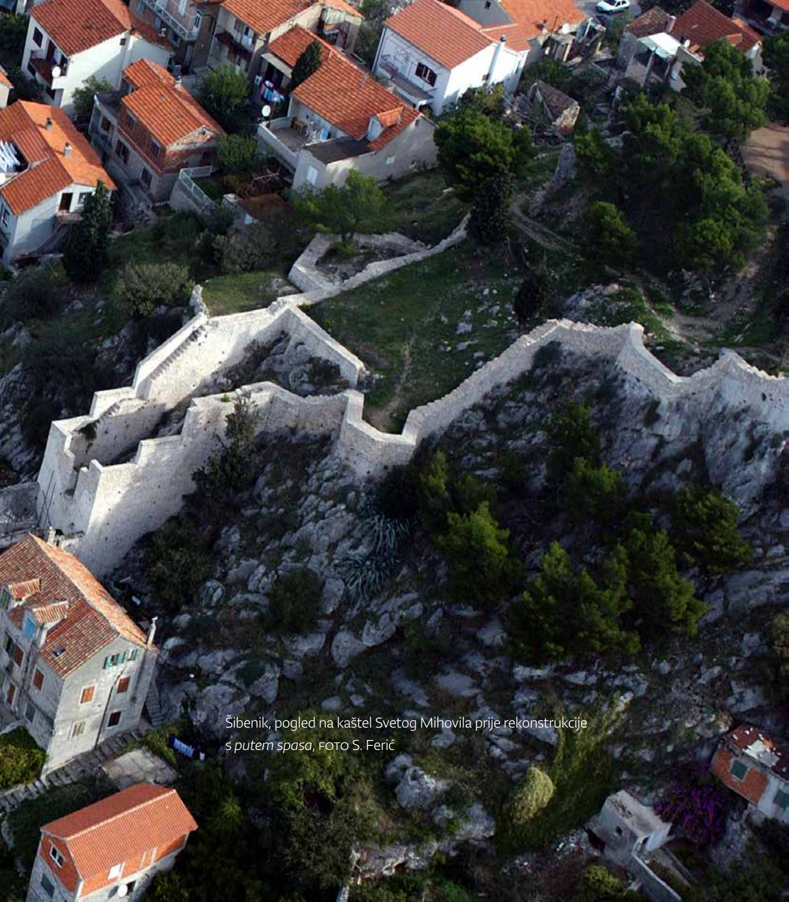
Šibenik, pogled na kaštel Svetog Mihovila prije rekonstrukcije s putem spasa, FOTO S. Ferić