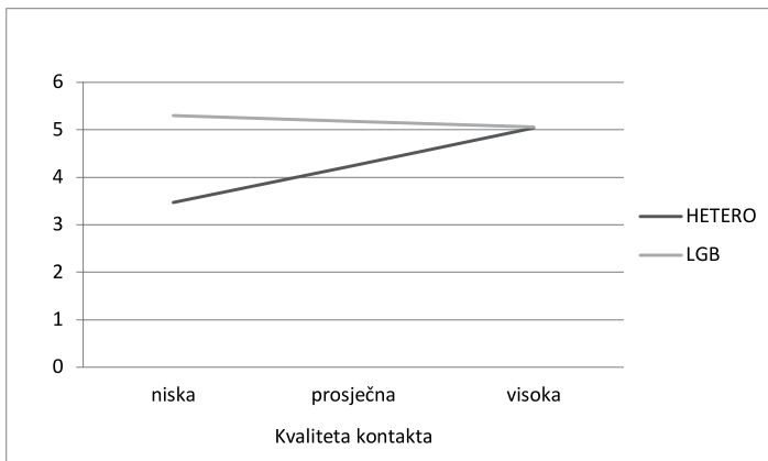
Slika 1. Moderacijski efekt grupnog statusa na odnos međugrupnog kontakta i spremnosti na kolektivnu akciju

Rezultati potvrđuju značajnu moderatorsku ulogu grupne pripadnosti, odnosno statusa grupe kojoj pojedinac pripada (heteroseksualna osoba ili pripadnik LGBTIQ osoba) u odnosu kvalitete međugrupnog kontakta i spremnosti na akciju usmjerenu na poboljšanje statusa manjinske grupe ( B=-0,976 , Bse= 0,19 , t=-5,14 , p<0,001 ). Kvalitetniji i pozitivniji kontakt s pripadnicima LGBTIQ manjine prati veća spremnost na kolektivnu akciju s ciljem poboljšanja statusa te grupe ( B= 0,85 , se= 0,13 , 95\% CI= 0,60, 1,09 ) u slučaju heteroseksualnih osoba. To, međutim, ne vrijedi za pripadnike LGBTIQ populacije ( B=- 0,13 , se= 0,14 , 95\% LLCI= - 0,41, 0,15 ) kod kojih je spremnost na takvu akciju uvijek vrlo (i podjednako) visoka, neovisno o kvaliteti kontakta s heteroseksualnim osobama. Slika 1. pokazuje odnos između kvalitete kontakta i spremnosti na ponašanja usmjerena na boljitak LGBTIQ zajednice za osobe heteroseksualne orijentacije i za pripadnike LGBTIQ zajednice.