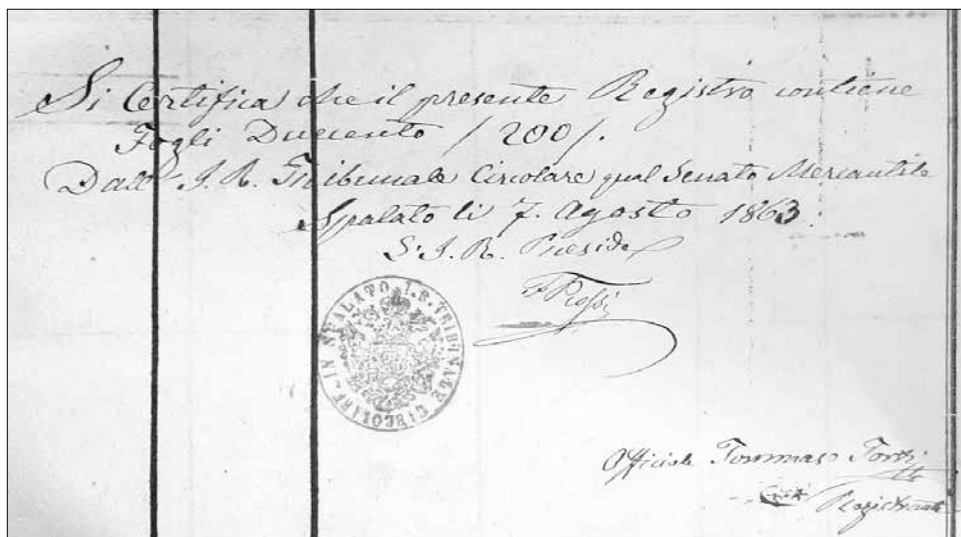
Slika 2. Ovjera na uvodnoj stranici HR-DAST-44/1.2 Trgovački registar A I, knj. 1.

Registar ukupno sadrži 231 upis i pravni slijed pretežno samostalnih tvrtki, kojima se evidentira svaka promjena naziva, djelatnosti, uprave, pravnog odnosa, sve do likvidacije.