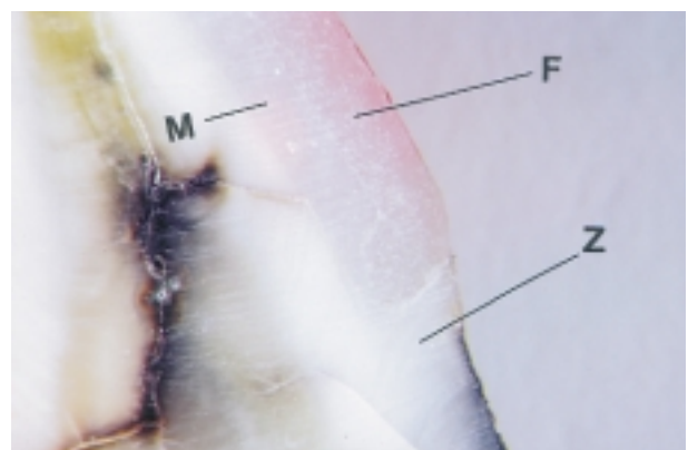
Legenda / Legend: F - keramička faseta / ceramic veneer Z - preparirano zubno tkivo / prepared dental tissue M - materijal za cementiranje / material for cementing

Podatci dobiveni mjerenjem prilagodbe faseta cementiranih Tetricom prema zubnome tkivu u 97,9% pokazali su idealnu prilagodbu (Slika 2), a samo u