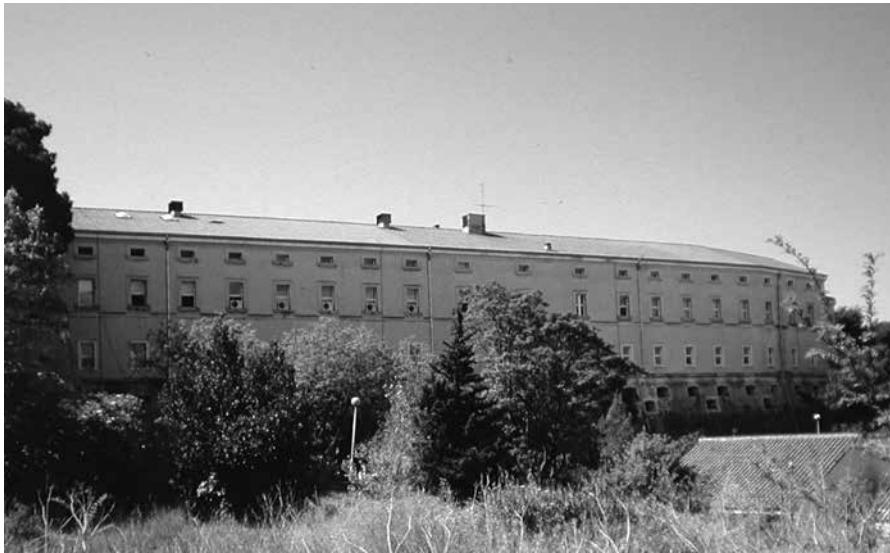
Slika 2. Tvrđava Gripe (fototeka DAST-a)