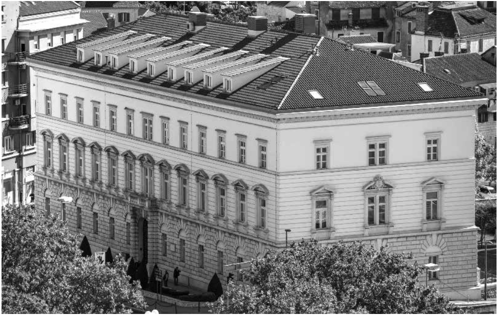
Slika 1. Sjedište Splitsko-makarske nadbiskupije, tzv. Biskupova palača, Poljana kneza Trpimira 7

Prema dopisu v.d. upravitelja Arhiva grada Splita, Srećka Diane 4 , već je tijekom 1957. Arhiv iseljen iz ovoga prostora, ustupljen je na korištenje Urbanističkom birou, a odlukom Predsjedništva N. O. općine Split, Arhiv grada Splita dobio je na korištenje uredski prostor na četvrtom katu i spremište u podrumu u tzv. Biskupovoj palači i još nekoliko privatnih spremišta. Prostor je od početka korištenja bio u potpunosti neprimjeren za obavljanje arhivske djelatnosti: vlažan, skućen i prenatrpan.