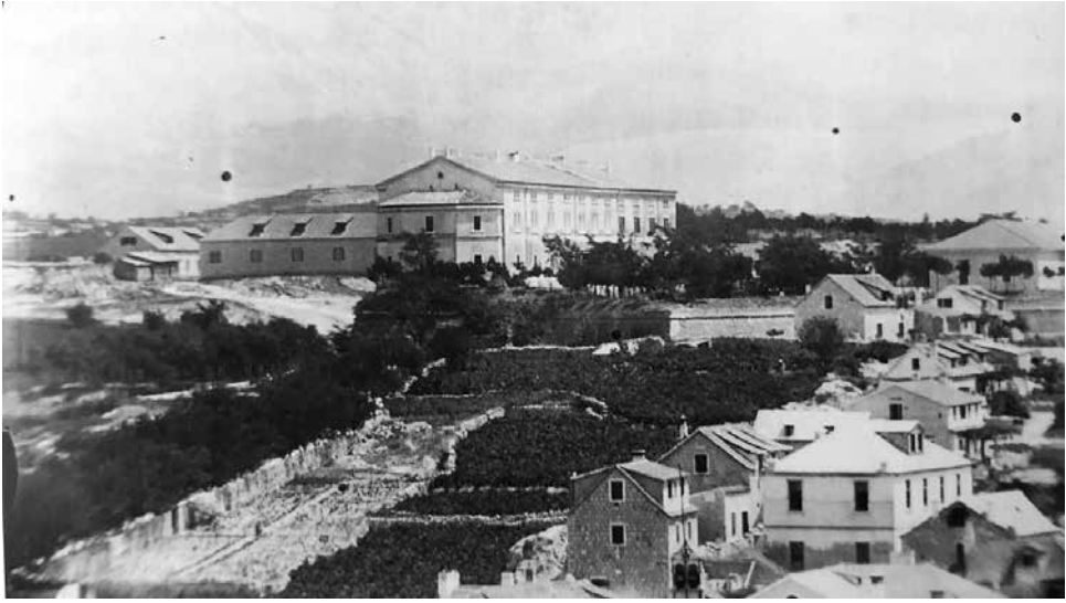
Slika 5. Lučac oko 1920. (čuva se u Muzeju grada Splita)