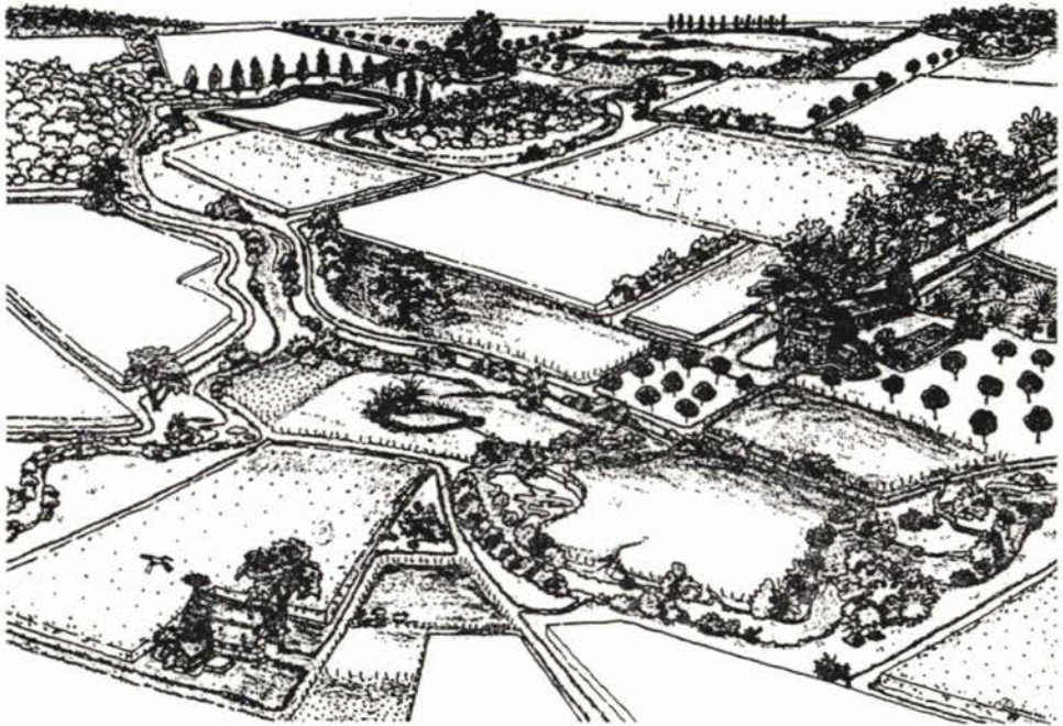
Sl. 1: Shematski prikaz sistema biotopa na agrarnom pejzažu, koji se sastoji od [4]: linijskih struktura (potoka sa obalama, žive ograde, drvoredi...) i u površinskih struktura (bare, šume, šikare, vrbaci, ugar...)