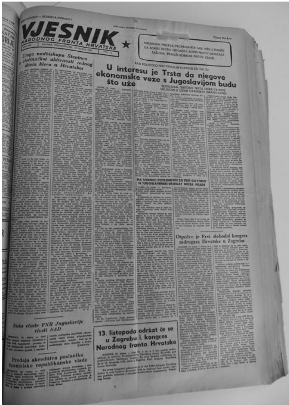
Vjesnik, 6. IX. 1946. broj 430