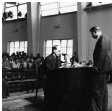
Nadbiskup Stepinac prelistava dokumente na suđenju

Desna fotografija: Što znate o dokumentu koji je nadbiskup Stepinac proglasio krivotvorinom na sudu (izvješće Piju XII. od 18. svibnja 1943.)? Koji su bili Stepinčevi argumenti za takvo kvalificiranje dokumenta?