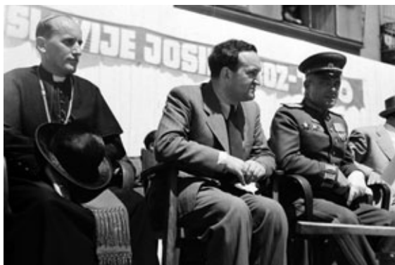
Nadbiskup Stepinac i Vladimir Bakarić na svečanoj tribini, Trg bana Jelačića u Zagrebu 27. VII. 1945.