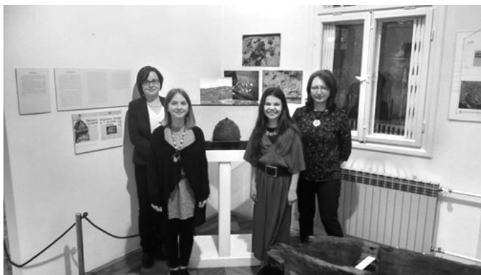
Slika 4: Muzej Brdovec – Kliofest 2021 .

(javna izložba), upoznavanje s projektom i drugih učenika, djelatnika škole, ali i šire lokalne zajednice putem praćenja projekta na mrežnim stranicama škole, lokalnom portalu ( e-Ivanec ) te, dakako, organizacija videokonferencije u sklopu nacionalne manifestacije Kliofest 2021 .