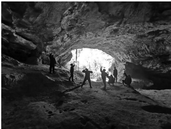
Slika 5: Špilja Vindija, izvanučionička terenska nastava

Učenje otkrivanjem daje najbolje rezultate i trajnost znanja. Osim dramatizacije i snimanja videa, kreativni izričaj učenika došao je do izražaja kreiranjem loga, zajedničkog Arheološkog dnevnika, 11 Kremenkovog menija 12 te pisanjem i slanjem KREMENKO čestitaka Glasovi iz prošlosti . 13