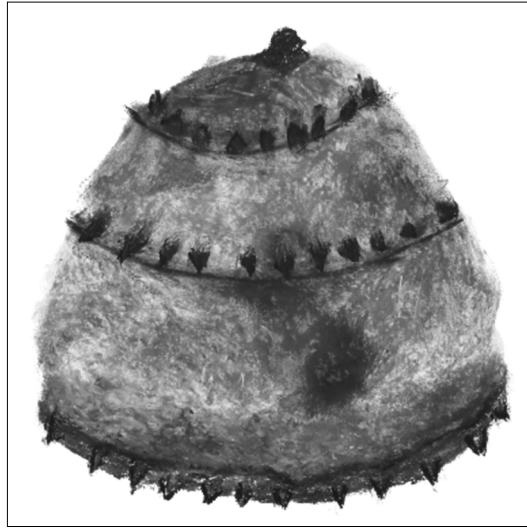
Slika 2: Kaciga iz Svetog Križa, rad učenika

i aktivno uključe u istraživanje teme. Učenje otkrivanjem daje najbolje rezultate i trajnost znanja. Da bi se to ostvarilo prilagodili smo se epidemiološkoj situaciji i aktivnosti organizirali virtualno.