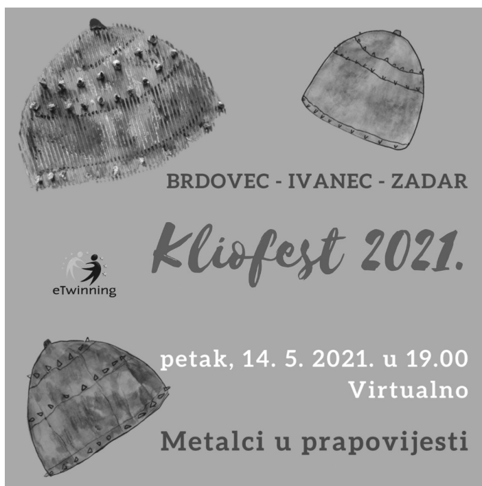
Slika 1: Digitalni plakat za virtualni Kliofest 2021 .

Potvrda dobro provedenog projekta je i nacionalna nagrada COMET za najbolji eTwinning projekt u kategoriji viših razreda osnovne škole. 1 Šk. god. 2021./2022. uključile smo više sudionika u videokonferenciju kao završnicu autorskog eTwinning projekta KREMENKO , ujedno dio nacionalne manifestacije Kliofest 2022 . Sudjelovali su mentori i učenici četiri osnovne škole. Organizirale smo predavanja vanjskih suradnika koja su učenicima omogućila učenje i proširivanje znanja kroz interaktivna predavanja i prezentacije stručnjaka prapovijesti. Povezali smo fakultete u Zagrebu i Zadru, arheološke odjele. Videokonferencija je organizirana kao javni događaj kojem su se mogli priključiti svi zainteresirani za arheologiju i prapovijest: učenici, roditelji, djelatnici škole, šira zajednica te je i na taj način omogućeno da nastava povijesti, prapovijesni sadržaji, budu dostupni i izvan učionice. Javnost je na događaj bila pozvana putem digitalnog plakata kreiranog za tu prigodu.