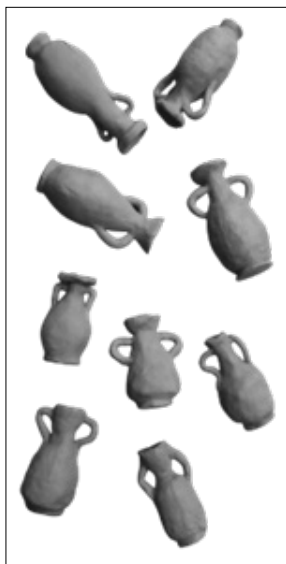
Slika 2: Amfore koje su izradili učenici na keramičkoj radionici

Na drugoj keramičkoj radionici učenici su izrađivali pečate s imenima vlasnika Loruna (Slika 3). Učenici su izradili pečat prvog vlasnika posjeda Sisenne Statilija, ali i ostalih vlasnika od kojih je najzanimljivija Calvia Crispinilla jer je živjela na dvoru cara Nerona. Prilikom izrade pečata učenici su morali pripaziti da imena vlasnika izrađuju naopako kako bi prilikom utiskivanja imena bila otisnuta pravilno.