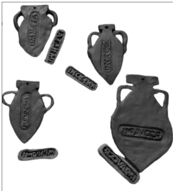
Slika 4: Plošne amfore s utisnutim pečatima vlasnika radionica koje su izradili učenici na keramičkoj radionici

Na posljednjoj keramičkoj radionici učenici su izrađivali plošne oblike amfora na koje su utiskivali pečate vlasnika radionica koji su prije toga bili ispečeni u keramičkoj peći (Slika 4).