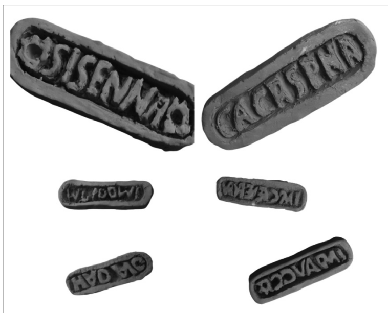
Slika 3: Pečati s imenima nekih vlasnika koje su izradili učenici na keramičkoj radionici

Na drugoj keramičkoj radionici učenici su izrađivali pečate s imenima vlasnika Loruna (Slika 3). Učenici su izradili pečat prvog vlasnika posjeda Sisenne Statilija, ali i ostalih vlasnika od kojih je najzanimljivija Calvia Crispinilla jer je živjela na dvoru cara Nerona. Prilikom izrade pečata učenici su morali pripaziti da imena vlasnika izrađuju naopako kako bi prilikom utiskivanja imena bila otisnuta pravilno.