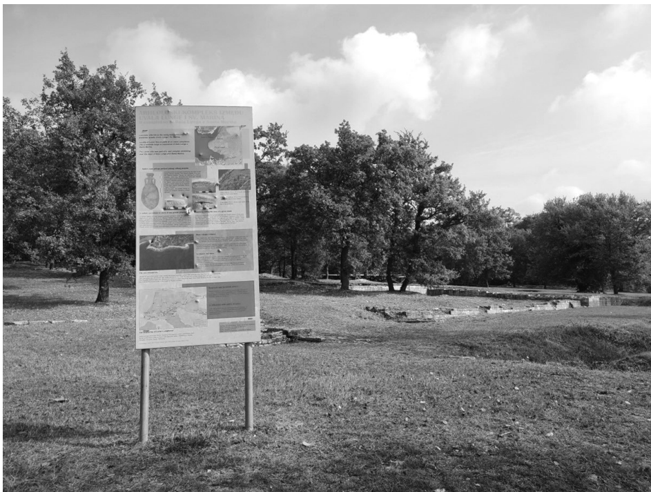
Slika 1: Arheološko nalazište Lorun