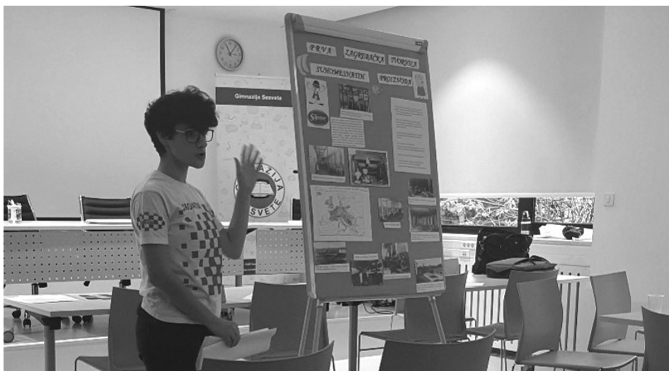
Slika 5: predstavljanje rezultata rada učenika u radionici Povijesni razvoj tvornice mesnih preradevina Sljeme

Drugom radionicom, pod vodstvom nastavnice Dijane Dijanić Pleško, učenice i učenici su analizirali povijesne izvore pomoću kojih su proučavali povijest mode i društveni položaj žena tijekom prve polovice 20. stoljeća. Na temelju slikovnih povijesnih izvora, učenice i učenici su istaknuli kontinuitet i promjene u odijevanju žena dvadesetog stoljeća, a objasnili su i utjecaj povijesnih događaja na promjene u društvenom i političkom statusu žena u navedenom razdoblju (Slika 6).