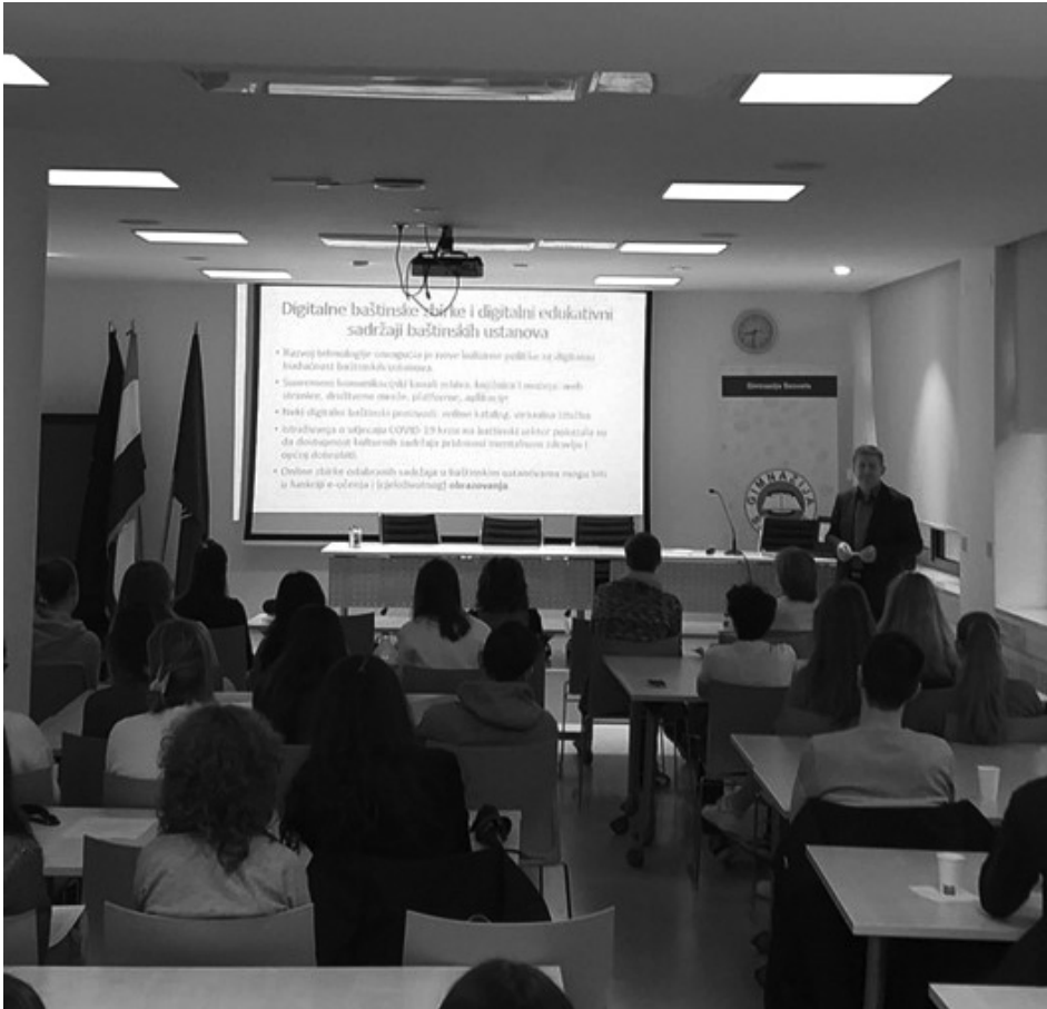
Slika 4: predavanje profesora Holjevca, Muzeji kao baštinska ustanova

Sajam povijesti nastavljen je s četiri paralelne radionice za učenice i učenike, pod vodstvom njihovih nastavnica Povijesti. Prvu radionicu, Povijesni razvoj tvornice mesnih preradevina Sljeme , vodila je nastavnica Povijesti Ugostiteljsko-turističkog učilišta u Zagrebu Ida Ljubić, koja je učenice i učenike vodila kroz analizu povijesnih izvora dobivenih iz Muzeja Prigorja (Slika 5). Radom na pisanim izvorima, učenice i učenici su izradili vremensku lentu povijesnog razvoja tvornice mesnih proizvoda Sljeme, kojom su prikazali kontinuitet i promjene u industrijskoj proizvodnji ove tvornice. Uz to, učenici su izradili povijesni zemljovid koji prikazuje puteve nabavke robe ove tvornice, kao i smjerove izvoza mesnih proizvoda. Opisali su uvjete rada u tvornici i gospodarski značaj proizvodnje tvornice Sljeme u Svesvetskom prigorju.