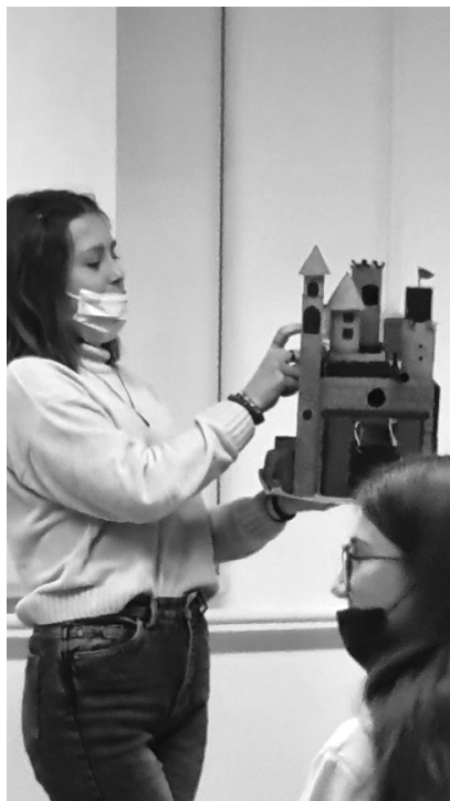
Slika 3: Učenica opisuje i objašnjava srednjovjekovni dvorac

Program su nastavile učenice prvih razreda Ugostiteljsko-turističkog učilišta, koje su prezentirale rezultate učenja u sklopu dodatne nastave Povijesti u svojoj školi. Učenicе su izradile makete i modele povijesnih građevina i osoba iz povijesti od recikliranog materijala. Predstavile su makete egipatskih piramida, model egipatskog faraona, zigurata, rimskog akvadukta i srednjovjekovnog dvorca (Slika 3). Učenicе su istražile povijest ovih građevina i povijesnih osoba, te su sudionicima prezentirale istražene informacije. U nastavku programa predstavile su i poster plakate s rezultatima istraživanja znamenitih Hrvatica i Hrvata kroz povijest, kao što su ban Ivan Mažuranić, ban Josip Jelačić, te preporoditelja Vatroslava Lisinskog, Ljudevita Gaja i Sidonije Rubido Erdödy.