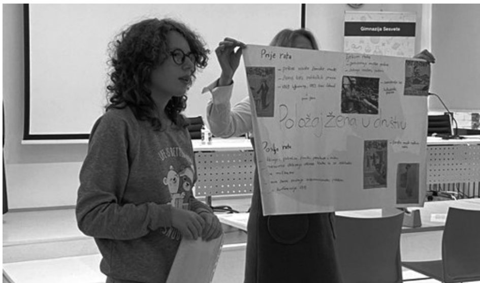
Slika 6: prezentacija grupnog rada o utjecaju povijesnih događaja na promjene u društvenom i političkom statusu žena

Drugom radionicom, pod vodstvom nastavnice Dijane Dijanić Pleško, učenice i učenici su analizirali povijesne izvore pomoću kojih su proučavali povijest mode i društveni položaj žena tijekom prve polovice 20. stoljeća. Na temelju slikovnih povijesnih izvora, učenice i učenici su istaknuli kontinuitet i promjene u odijevanju žena dvadesetog stoljeća, a objasnili su i utjecaj povijesnih događaja na promjene u društvenom i političkom statusu žena u navedenom razdoblju (Slika 6).