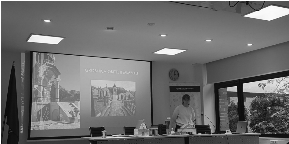
Slika 10: učenica prezentira svoj rad o Povijesti Orebića