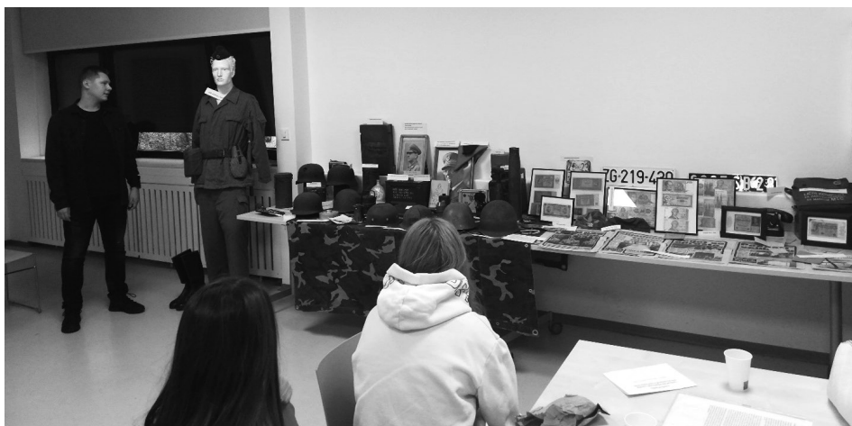
Slika 12: izložba Vojna memorabilija iz 20. stoljeća

Drugi Sajam povijesti završio je druženjem kroz razgovor prisutnih učenika i učenička, te njihovih nastavnica. Razmjenjivali su dojmove i stečena znanja, te su izrazili želje da se u idući Sajam povijesti uključi što više učenika i učenika srednjih škola. Učenici su ispunili anketu u kojoj su izrazili svoje zadovoljstvo Sajmom povijesti.