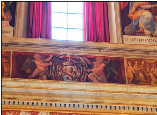
Slika 7. Grb pape Siksta V. (1585.–1590.) u hrvatskoj crkvi Sv. Jeronima u Rimu.

uklesati u temelje obeliska na Trgu svetoga Petra. Osim toga, Siksto V. je u svo- me papinskome grbu također imao lava u propnju u čemu možemo prepoznati privrženost sv. Jeronimu, ali i domovini njegovih predaka.