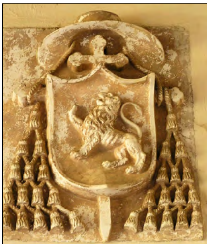
Slika 3. Grb Jeronimita u Monasterio de la santa Maria de el Parall kod Segovie.

Klesani grb Jeronimovaca s lavljim likom nalazi se u jedinom njihovom danas aktivnom samostanu Monasterio de el Parall kod Segovie, a datira iz kraja XV. stoljeća. U isto vrijeme izrađen je i sličan grb Jeronimovaca u Monasterio de la Santa Catalina u kastiljskome gradu Talavera de la Reina. Grbovi su gotovo identični, s lavom u propnju te križem i prelatskim šeširom s resama u nakitu. S obzirom na to da su Jeronimovci utemeljeni u drugoj polovici XIV.