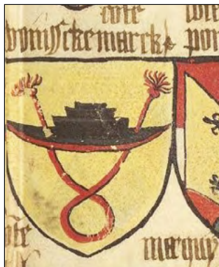
Slika 18b. Grand Armorial équestre de la Toison d'or (1429. – 1461.).