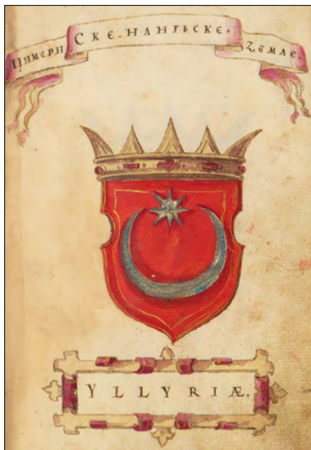
Slika 16a. Grb Ilirije.

Najzad, postavlja se pitanje odakle potječu i što u grbu Ilirije s kraja XVI. stoljeća, simboliziraju stari i rašireni likovi mladog mjeseca i zvijezde? Lunarno-stelarni par u različitim stilizacijama spada među arhetipske simbole koji u