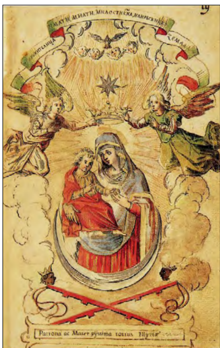
Slika 17a. Gospa Olovska s mjesecom i zvijezdom u Korjenić-Neorićevu grbovniku.

svim epohama, kulturama i religijskim sustavima imaju široki raspon značenja. Zbog opće rasprostranjenosti i uporabe nebeskih likova u literaturi, došlo je do niza pogrešnih tumačenja njihova podrijetla u grbu Ilirije.