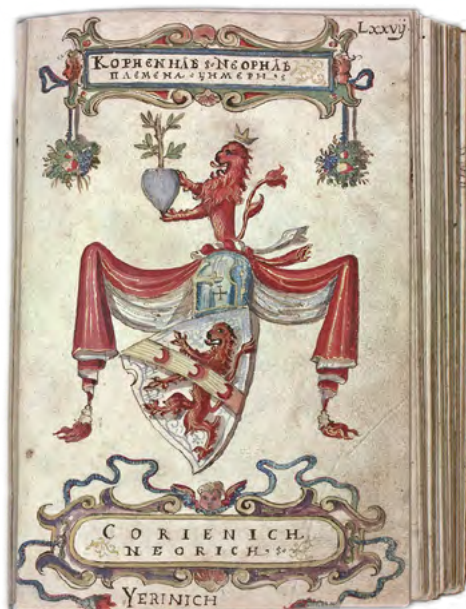
Slika 9. Grb Korjenić-Neorić-Jerinića u njihovom grbovniku iz 1595.

Tako i sami vlasnici našega prvog armorijala, Korjenić-Neorići iz Slanoga, čije se prezime u drugoj polovici XVI. stoljeća stabiliziralo u obliku Jerinić (!), homonimijski stavljaju Jeronimova lava na grb svoga roda na listu 77.