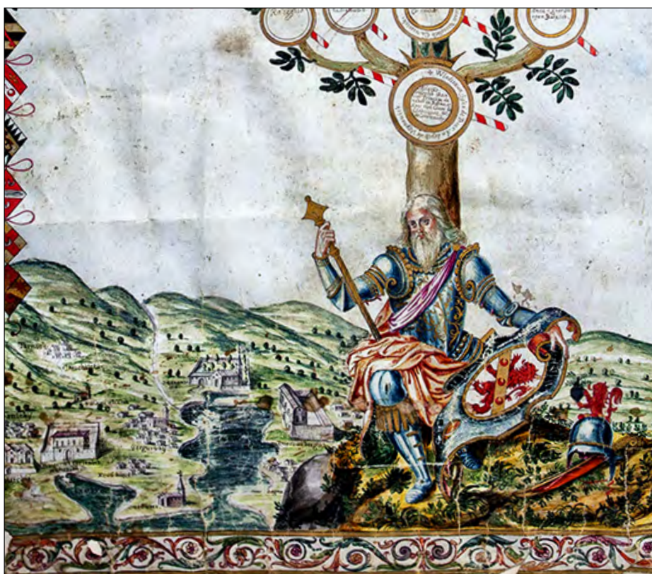
Slika 11. Segment rodoslovlja Korjenić-Neorić-Jerinića s grbom roda i prikazom samostana Sv. Jeronima.