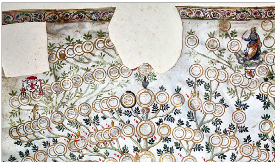
Slika 10. Segmenti rodoslovlja Ohmučevića i Korjenić-Neorić-Jerinića s početka XVII. stoljeća.