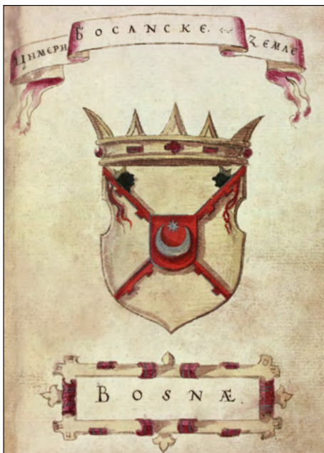
Slika 16b. Apokrifni grb Bosne s leljivima.