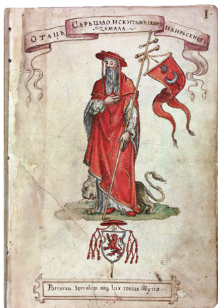
Slika 8. Sveti Jeronim i njegov grb na prvom ilustriranom listu Korjenić-Neorićeva grbovnika iz 1595.

preuzeli iz iberške sredine, no oni su svetojeronimski kult razvili u domovini, ponajviše zaslugom franjevacu iz samostana Sv. Jeronima u Slanome kojega je Dubrovačka Republika utemeljila početkom XV. stoljeća, a koji je dulje od jednog stoljeća bio dio Bosanske vikarije.