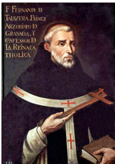
Slika 5. Hernand de Talavera (1428.–1507.), nadbiskup Granade.