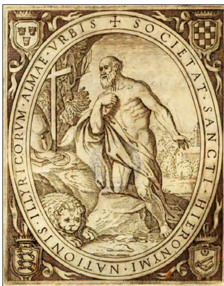
Slika 12. Sveti Jeronim i grbovi hrvatskih zemalja na Bonificijevom letku iz 1584. Najstariji poznati prikaz mladoga mjeseca i zvijezde u ilirskoj heraldici .