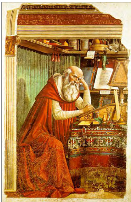
Slika 1. Domenico Ghirlandaio, Sveti Jeronim u radnoj sobi , 1480.

uvriježenog mišljenja o svečevu dalmatinskom, odnosno „ilirskom“ podrijetlu njegov je kult bio osobito raširen u hrvatskim zemljama i među Hrvatima uopće. U radu ćemo tematizirati nastanak i uporabu svetojeronimskih simbola u europskom grbovništvu, a napose u hrvatskoj heraldici. Prema biografskim motivima, predaji i srednjovjekovnim konfabulacijama već su u gotičkome slikarstvu oblikovani ikonografski obrasci koji ovoga sveca povezuju s više atributa. Kao crkvenoga naučitelja ( doctor maximus ) najčešće ga se prikazuje s knjigama, napose s Biblijom i kardinalskim šešikom ili, pak, kao pustinjaka odjevena u kostrijet u eremitskoj izbi, najčešće u društvu lava. 3