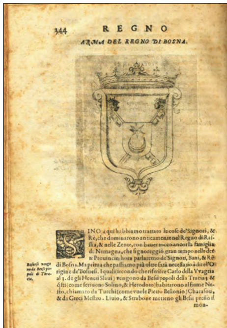
Slika 14. Apokrifni grb Bosne s leljivima u djelu Mavra Orbinija Kraljevstvo Slavena iz 1601.

Mlađak i zvijezdu u paru, kao dio bosanskoga grba, osim na letku rimskoga Zavoda sv. Jeronima iz 1584., nalazimo i na nadgrobnoj ploči Katarine Kotromanić Kosača, koja je iznova izrađena oko 1590. u rimskoj crkvi Aracoeli . U obama potonjim slučajevima mladi mjesec i zvijezda pojavljuju se na štitu kao dodaci glavnome heraldičkom liku, ruci sa sabljom, u sklopu tada već poznatog bosanskog grba habsburškog postanja. Štit s polumjesecom i zvijezdom, uklopljen u apokrifni grb Bosanskog kraljevstva, pojavljuje se i u djelu Il Regno de gli Slavi Dubrovčanina Mavra Orbinija, koje je tiskano u Pesaru 1601. godine.