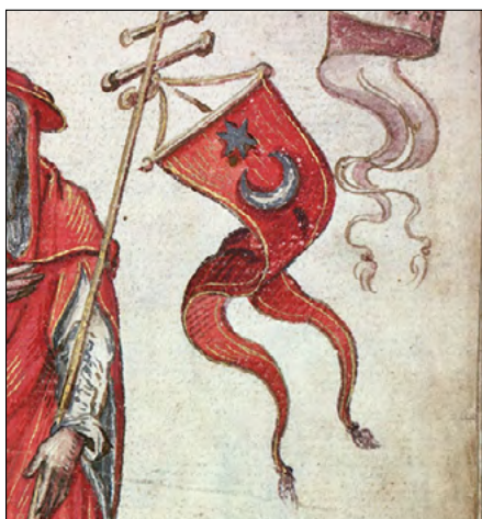
Slika 16c. Zastava sv. Jeronima s mladim mjesecom i zvijezdom. (Korjenić-Neorićev grbovnik iz 1595.)