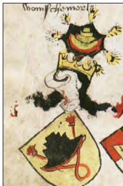
Slika 18a. Grb Windische Mark iz grbovnika: Bergshammar (1440-ih).

stanovništvom. 16 S druge strane i Kranjci se spominju među osnivačima Sve-tojeronimske bratovštine pa je i to moglo utjecati da u „slovinskom“ grbu slavonske atribucije sa šeširom kardinalskog oblika bude prepoznata simbo-lika sv. Jeronima.