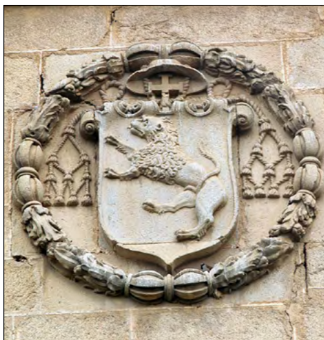
Slika 4. Grb Jeronimita u Monasterio de la Santa Catalina u Talavera de la Reina.

stoljeća, a da se njihov grb s lavom javlja tek potkraj XV. stoljeća, opravdano pretpostavljamo da ga je redovnička zajednica preuzela od svoga najznamenitijeg člana Hernanda Talavere (1428. – 1507.) iz mjesta Talavera de la Reina.