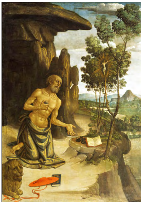
Slika 2. Bernardino Pinturicchio, Sveti Jeronim u divljini , 1475. – 1480.

Semantičkim redukcijama, kao Jeronimovi glavni heraldički simboli u katoličkom svijetu od XV. stoljeća ustalili su se likovi lava i kardinalskog šešira. 4 Lav i kardinalski šešir u grbu njegovi su izravni simboli. Koliko nam je dosad