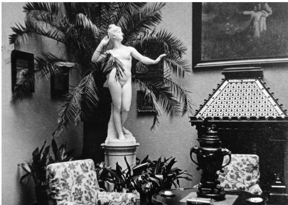
Slika 7: Interijer kuće Adama Reisnera, vlasnika tvornice šibica „Drava“

Židova može odmah početi vraćati, uz napomenu da utječe na te ljude kako bi knjige poklonili centralnoj knjižnici i time „širokim narodnim slojevima pružili dobru knjigu i pomoć njegovu kulturnom uzdizanju“. 118 U skladu s tim počeo je predmete izdavati bivšim vlasnicima uz potvrdu o primitku koju su morali potpisati. Ponekad se izdavalo i uz jednog svjedoka ako se nije moglo ustanoviti vlasništvo, dok je u nekim slučajevima slao pozive vlasnicima ukoliko bi imao kakvih saznanja o njihovim predmetima u Muzeju tako da se Muzej počeo polako prazniti ali gotovo istovremeno, samo u puno manjoj mjeri, opet se počeo i puniti konfisciranim predmetima izbjeglih Nijemaca kao što su npr. poznatije osječke obitelji Reisner (Slika 7), Povischil, Šmit, Reimann i dr. ali sada preko Gradske uprave narodnih dobara a temeljem zakonske odredbe Nacionalnog komiteta oslobođenja Jugoslavije od 20. 2. 1945. o zaštiti i čuvanju kulturnih spomenika i starina.