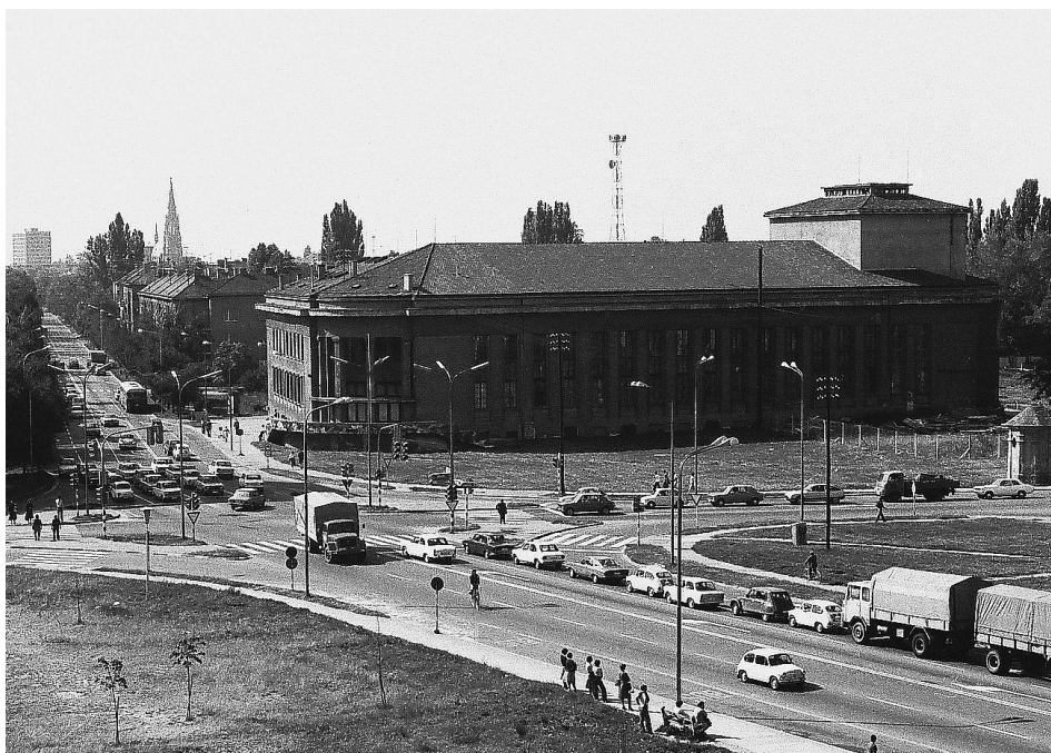
Slika 6: Njemački dom u Osijeku

U Njemačkoj se Schmidt, nakon što mu je izgorio dio prtljage u Münchenu pri zračnom napadu, smjestio s obitelji u Marquartstein (Bavarska), blizu austrijske granice, odakle se pismom javio Rudolfu Schmidt u Osijek. Od njega je zatražio žurnu otpremu cjelokupnog materijala za Beč, odakle bi se dalje, kao vojni tovar, prevezao u Marquartstein. 100 Rudolf Schmidt, direktor Heimatmuseum-a, već je uveliko bio zaokupljen rješavanjem otpreme materijala iz Hrvatske. Tako je krajem listopada od Altgayera dobio nalog za odlazak u Njemačku na tri mjeseca zbog tog posla. 101 Predmeti iz Heimatmuseum-a i arheološki materijal otpremljeni su iz Hrvatske u pravcu Njemačke u dva navrata. Prvi transport koji odlazi početkom studenog 1944. stiže u Steyr (Gornja Austrija) 17. studenog 1944. Drugi transport otpremljen je po svemu sudeći u sljedećih nekoliko dana. Na kraju je bilo sveukupno 107 sanduka materijala iz Osijeka. 102 Prema tamo napravljenom popisu u 35 sanduka nalazio se tzv. politički arhiv Njemačke narodne skupine, knjige među kojima je bilo raritetnih i unikatnih primjeraka, činile su znanstvenu knjižnicu dr. Rudolfa Schmidta i bilo ih je 49 sanduka. Među ovim sanducima