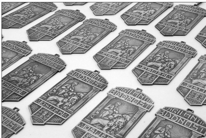
Slika 1: Dio slobodnozidarskih predmeta iz osječke lože (Muzej Slavonije)