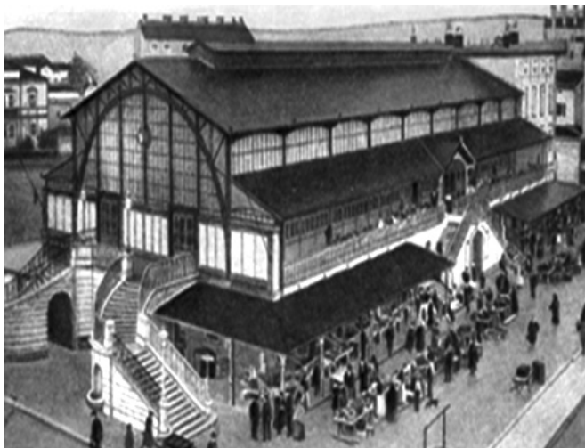
Slika 3: Tržnica – vanjski dio – PPMI – 52789. jpg