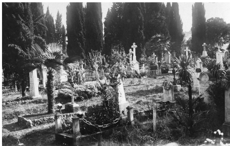
Slika 5: Mornaričko groblje – PPMI 51617.jpg