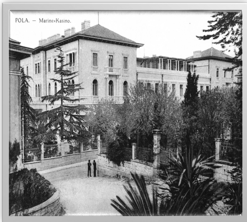
Slika 4: Mornarički kasino – druga faza – PPMI – 53211.jpg