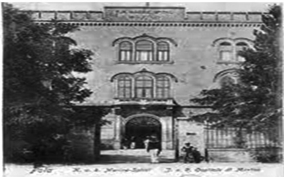
Slika 2: Mornarička bolnica, https://www.istria-culture.com/vojna-bolnica-u-puli-i136 , (posjet 2.8.2021.)