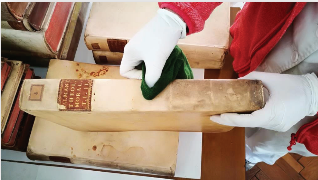
Slika 5. Očišćeni i neočišćeni dio