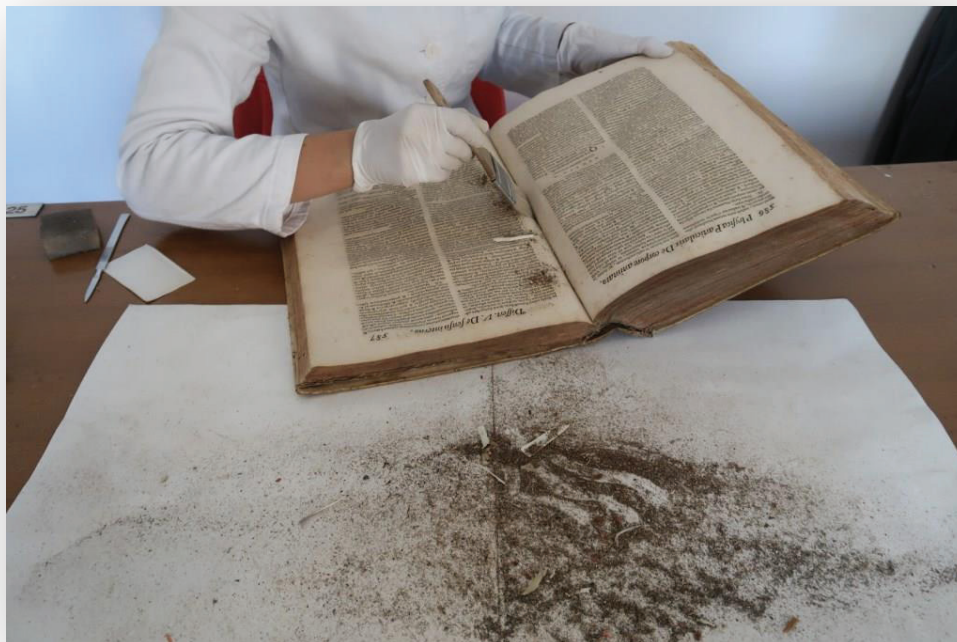
Slika 2. Čišćenje knjižnog bloka kistom od organskih vlakana

Kako izgleda građa tijekom postupka preventivne konzervacije prikazano je na sljedećim slikama.