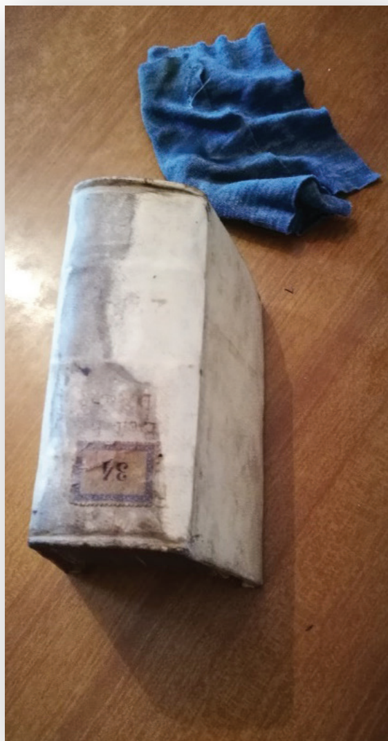
Slika 6. Očišćeni i neočišćeni dio

Budući da u knjižničnom fondu Sveučilišne knjižnice postoji još nekoliko tisuća svezaka građe izdane prije 1850. godine, isti je program prijavljen i za 2023. godinu. Nadamo se nastavku radova na zaštiti naše najstarije građe.