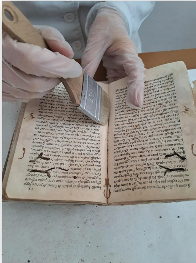
Slika 4. Primjer oštećenja