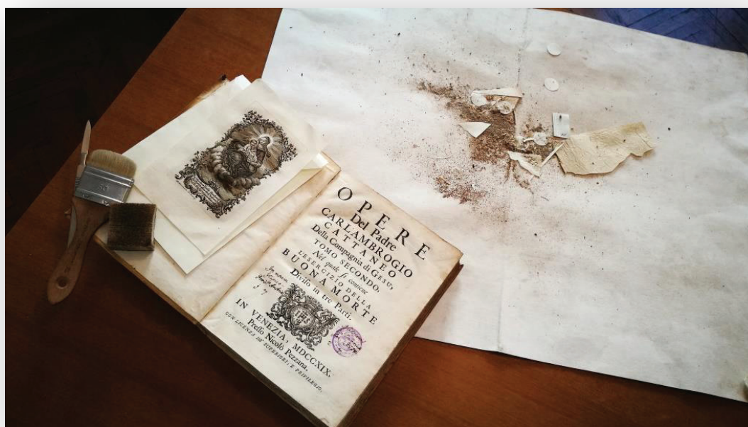
Slika 3. Pribor za mehaničko čišćenje građe