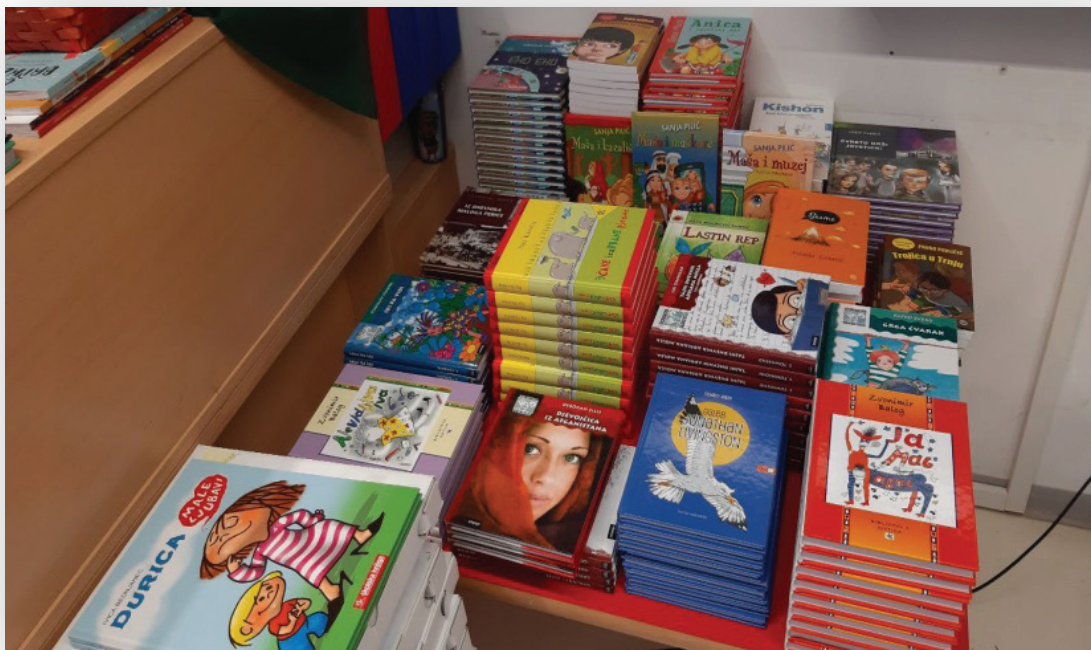
Slika 1. Novi naslovi u knjižnici (rujan 2021. godine)