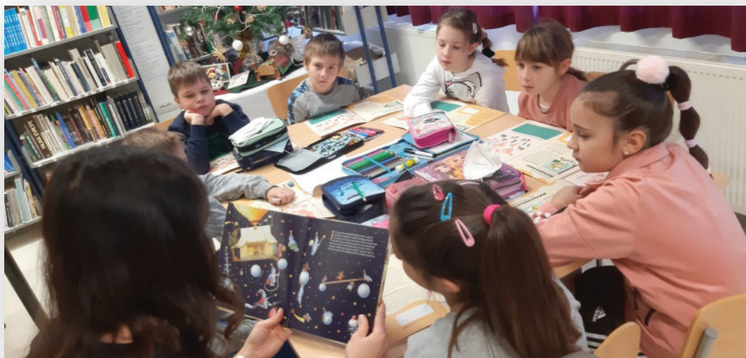
Slika 6. Sat čitanja slikovnice „Medvjedovanje“ K. Kasparavičiusa (iz projekta NMK) s učenicima 2.b.

... a od jeseni 2021. godine i u međunarodnom čitalačkom projektu Naša mala knjižnica . 4