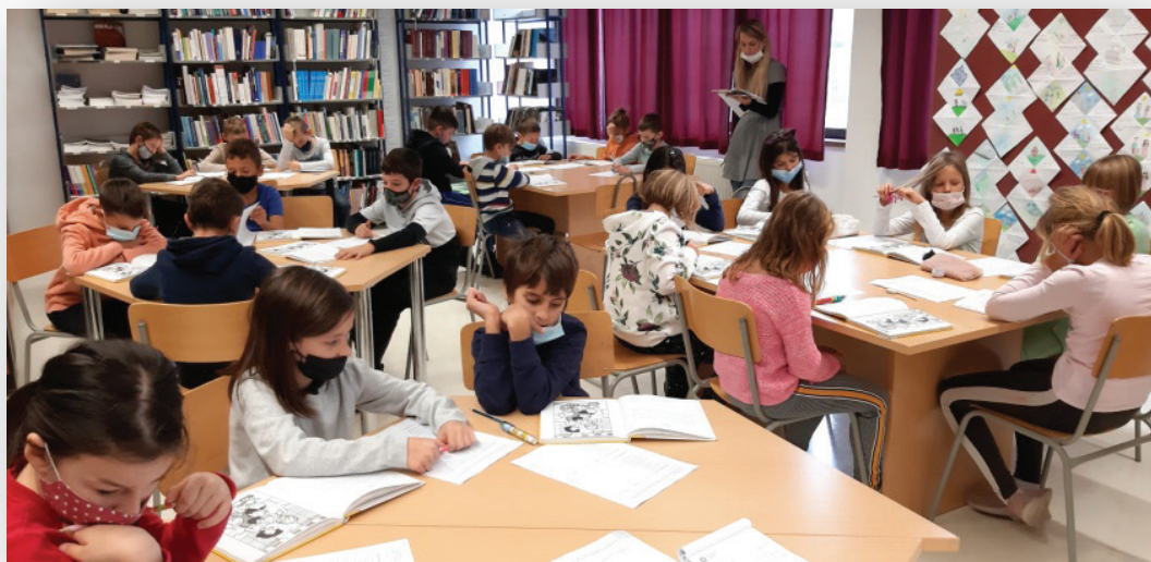
Slika 4. Učenci 3.d na Čitateljskom maratonu 2021.