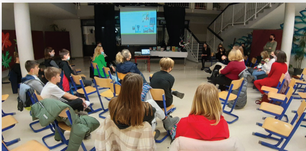
Slika 7. Druženje „mama čitateljica“ i učenika u predvorju škole