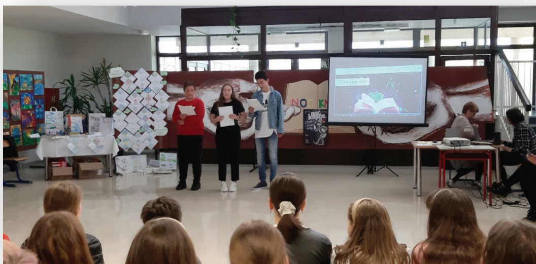
Slika 8. Detalj s Noći knjige 2022. u predvorju škole

Od ostalih „knjižnih“ datuma svakako je nezaobilazan i Međunarodni dan darivanja knjiga (14. veljače) koji je po treći put obilježen humanitarnom akcijom, tj. prikupljanjem slikovnica i knjiga za polaznike dječjih vrtića s područja Srdoča. Prikupljeno je 100-tinjak svezaka (78 slikovnica, 10 dječjih knjiga, 14 (lektirnih) naslova koji su odvojeni za potrebe školske knjižnice te 21 primjerak dječjih časopisa), a primopredaju je izvršila školska knjižničarka 22. veljače.