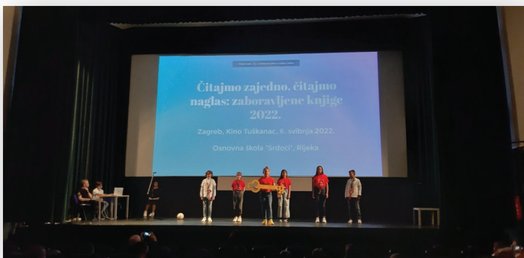
Slika 5. Srdočani na završnici ČZČN-a u Kinu Tuškanac u Zagrebu