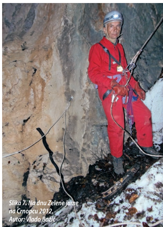
Slika 7. Na dnu Zelene jame na Crnopolcu 2012.

je i konstruirao klupicu za sjedenje jer ga je pojas žuljao, što mu je omogućilo da dulje visi na užetu bez napora. U to vrijeme nije bilo kupovnih prostirki – karimata, pa je Deda sebi napravio prostirku od stiropora utkanu u najlonsku foliju, koja se otvarala kao harmonika i činila spavanje na tvrdim podlogama ugodnijim.