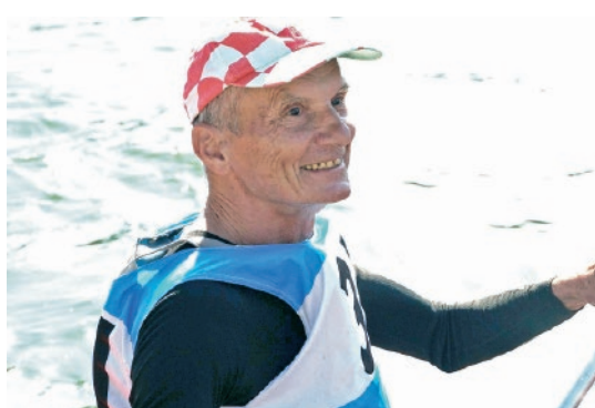
Slika 5. Na tradicionalnom veslačkom maratonu Sava 21, 2021.

Deda je bio aktivan u Satniji i nakon aktivnog služenja u ratu. U poslijeratnom razdoblju dao je mnogo podataka i fotografija za knjigu o Planinskoj satniji »Velebit«, kao i za film o Satniji. Sudjelovao je i na memorijalnim okupljanjima (postrojbi i prozvkama bivših članova Planinske