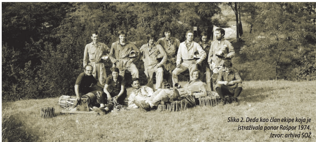
Slika 2. Deda kao član ekipe koja je istraživala ponor Rašpor 1974.

i turistički uređene špilje, Lokvarku i Vrlovku u Hrvatskoj, Postojnsku i Škocjansku špilju u Sloveniji, špilju Grotta Gigante u Italiji te špilje Luhrgrötte i Eisriesenwelt u Austriji. Osobni rekord dubine, koji iznosi –283 m, postigao je 23. kolovoza