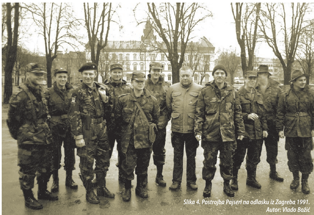
Slika 4. Postrojba Pajseri na odlasku iz Zagreba 1991. Autor: Vlado Božić