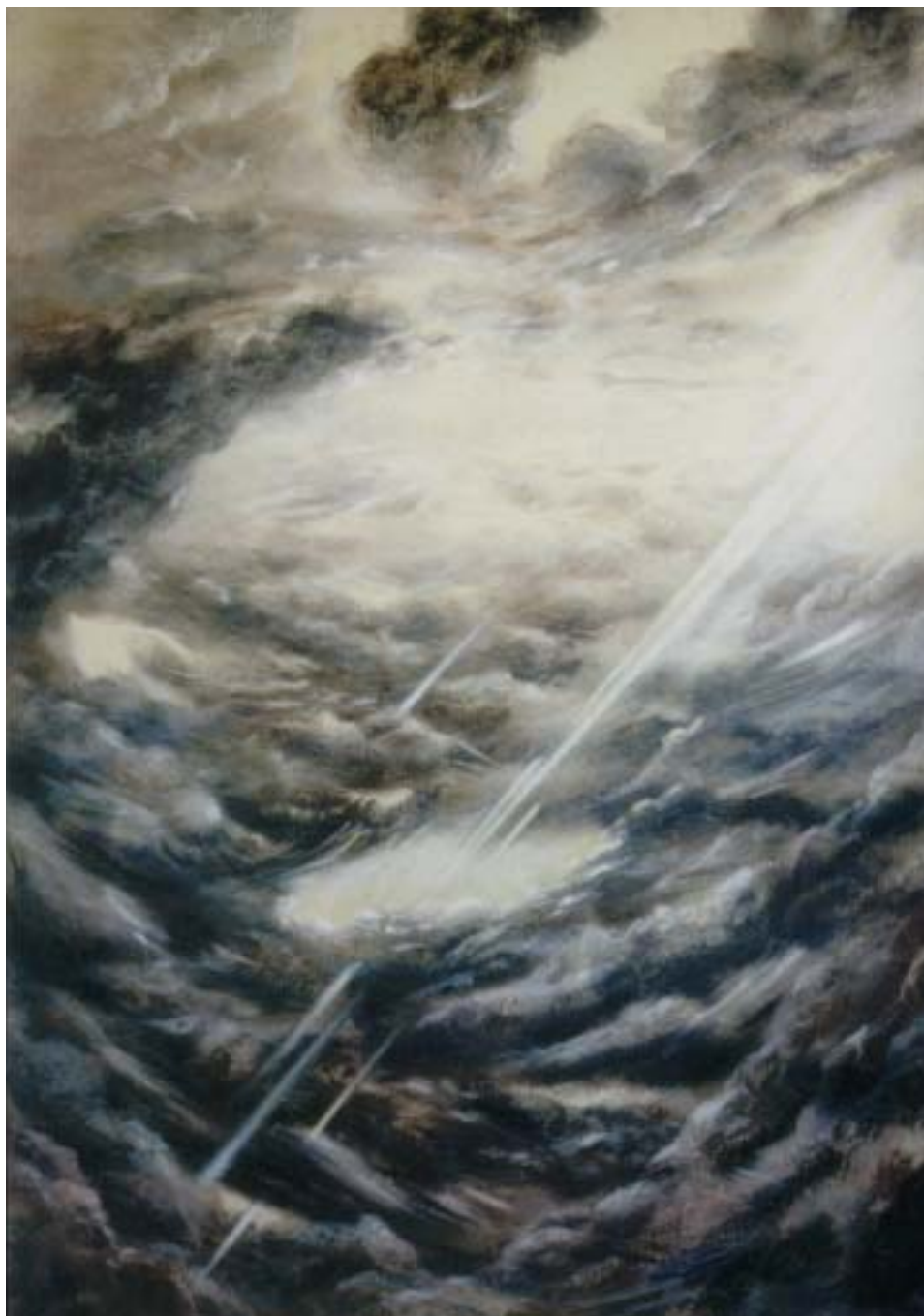
Marijan Jakubin: Poniranje prema beskraju, 1998